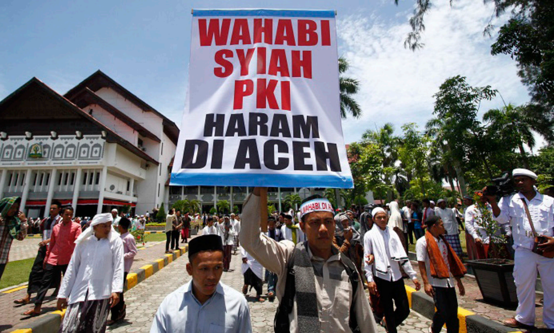
Foto massa saat Parade Aswaja di Banda Aceh.

Sementara Wahabi ditolak karena pahamnya yang sangat radikal dalam beragama. Mereka sangat cepat sekali membid'ahkan amalan umat Islam, bahkan tidak jarang mereka mengkafirkan kelompok umat Islam selain kelompok mereka. Terhadap kelompok ini, salah satu kelompoknya bahkan sudah difatwakan sesat oleh Majelis Permusyawaratan Ulama (MPU) Aceh. Sementara itu, Komunis pun sudah jelas menunjukkan bahayanya. Tidak sedikit pengikut ajaran tanpa Tuhan ini, khususnya di Pulau Jawa.