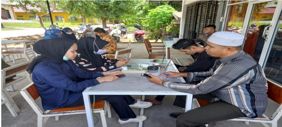
Tim peneliti sedang mewawancarai mahasiswi Unimal