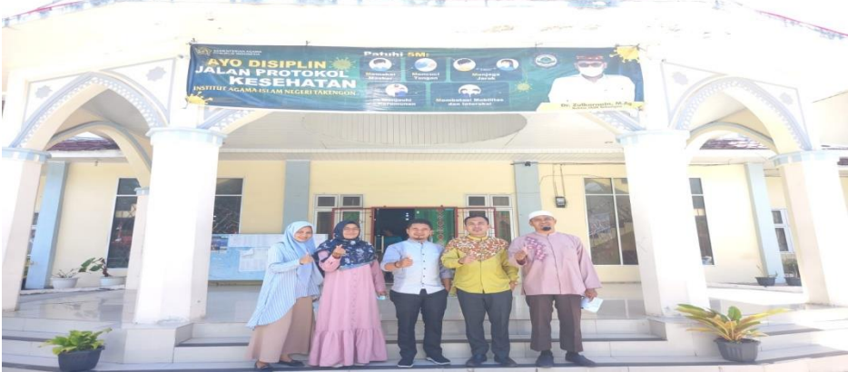
Pengumpulan data di kampus IAIN Takengon