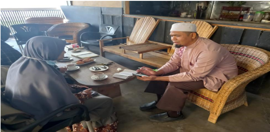
Tim peneliti melakukan wawancara dengan mahasiswi IAIN Takengon