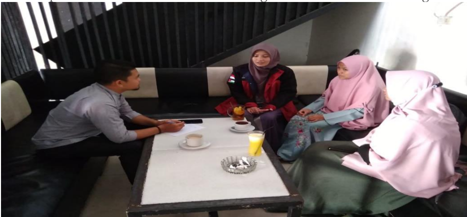
Tim peneliti sedang mewawancarai mahasiswi IAIN Takengon