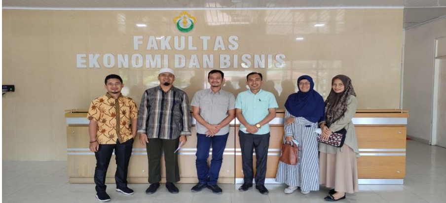
Tim peneliti bersama salah seorang dosen Unimal Fak. Ekonomi dan Bisnis Unimal