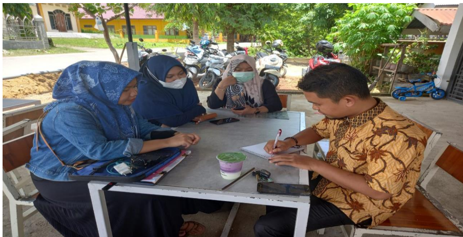
Tim peneliti sedang mewawancarai mahasiswi Unimal