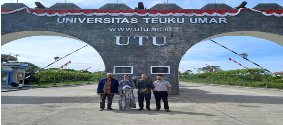
Tim Peneliti Berfoto di Pintu Gerbang UTU