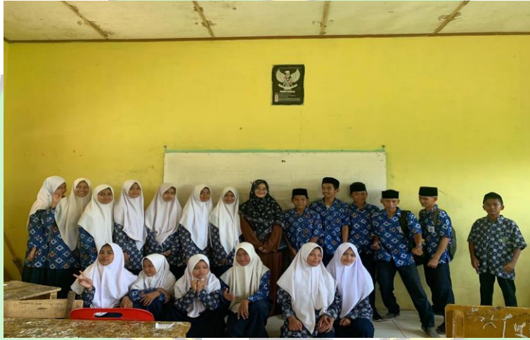
عملية التعليم باستخدام أسلوب الترفيهي