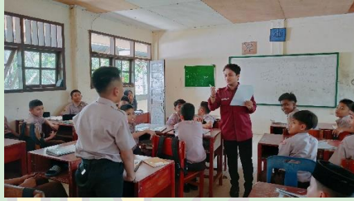
إعطاء الاختبار القبلي.