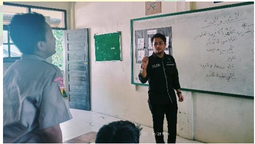
إعطاء الاختبار البعدي.