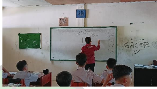
التجربة الأولى (التعليم بدون استخدام طريقة المحاكاة بوسيلة Display).