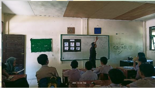
التجربة الثانية (التعليم باستخدام طريقة المحاكاة بوسيلة Display).