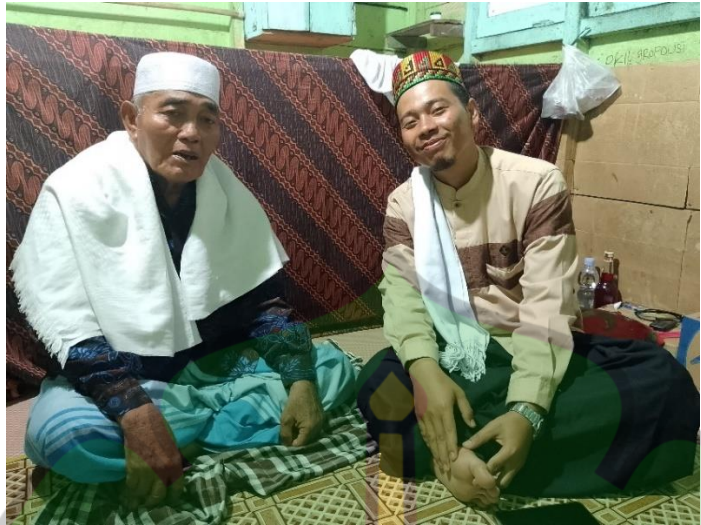
Gambar 4 Bersama Khalifah Sultan