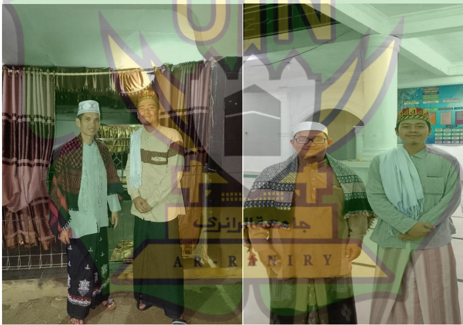
Gambar 5 Bersama Khalifah Asmalaruddin