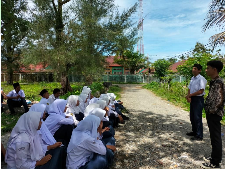
عملية التعليم باستخدام Field Trip