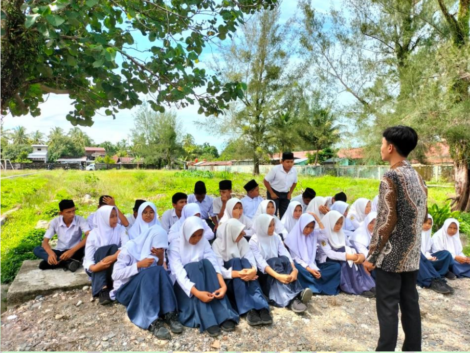
عملية التعليم باستخدام Field Trip