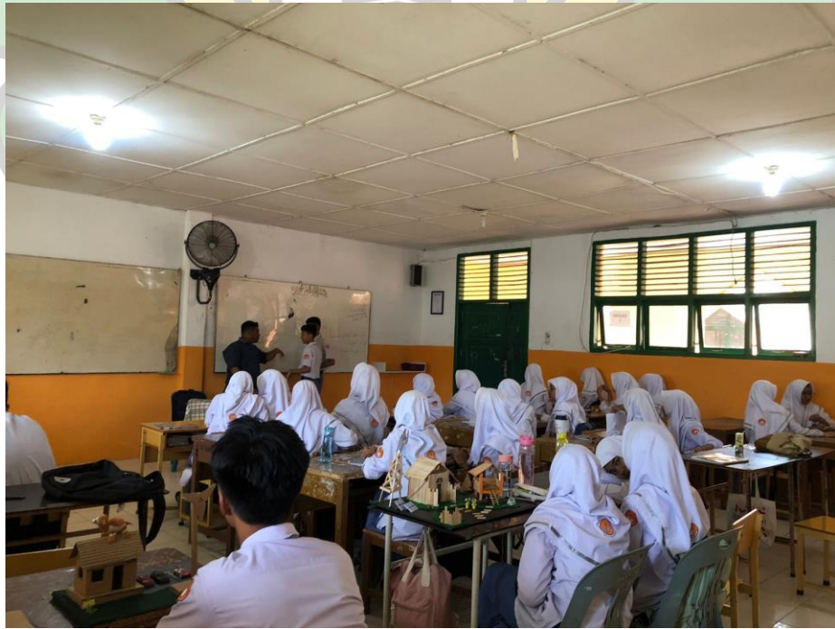
الاختبار البعدي والاستبانة