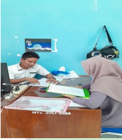
أجرى الباحثة مقابلات مع المعلم