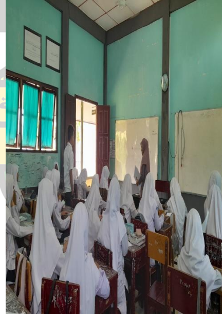
تقسم الباحثة الإستبانة