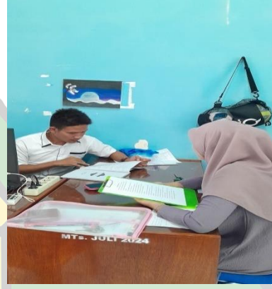
أجرى الباحثة مقابلات مع المعلم