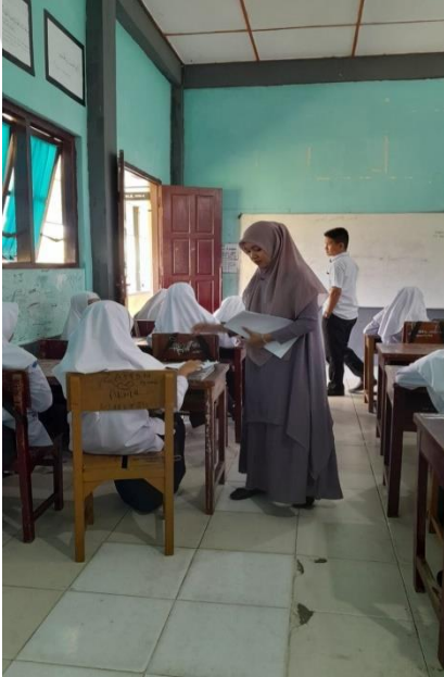
تقسم الباحثة الإستبانة