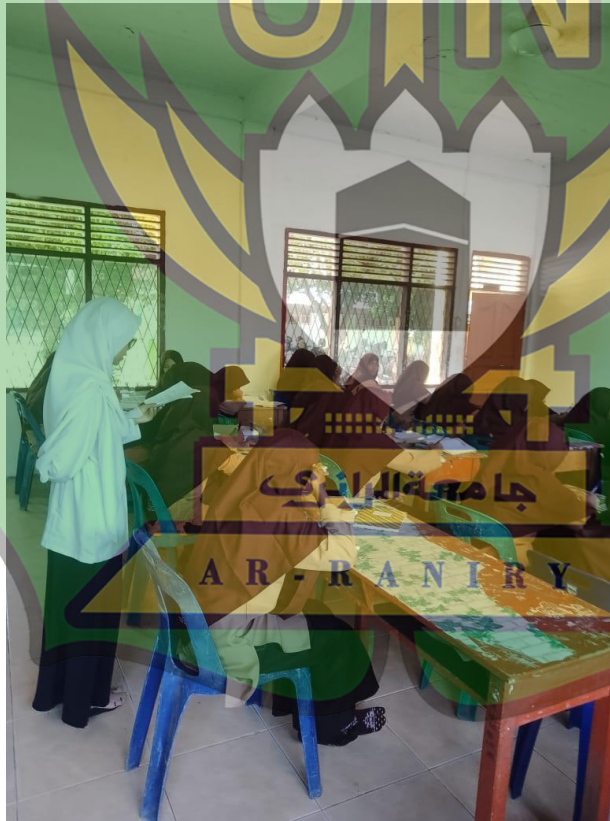
صورة ٥. يقوم الطلبة الاختبار البعدي