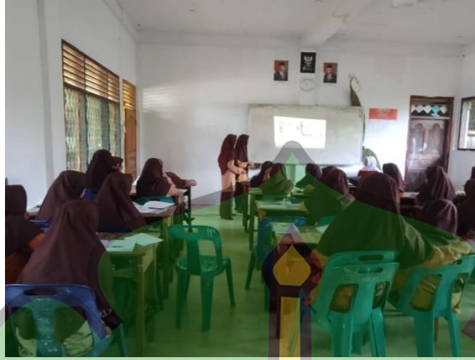
صورة ٤. يقدم الطلبة عرضاً لنتائج المناقشة