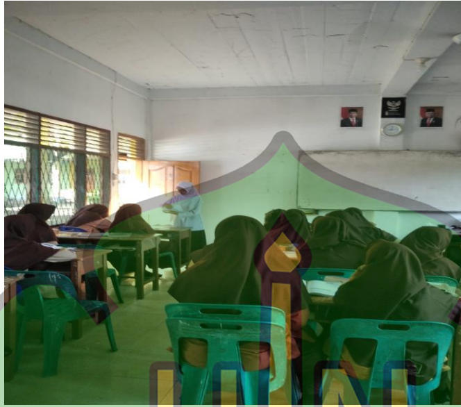
صورة ١٠. يقوم الطلبة الاختبار القبلي