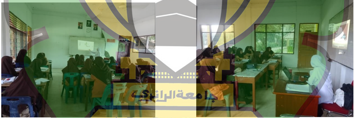
صورة ٢٠. يشاهد الطلبة الفيديو We Bare Bears صورة ٣٠. المدرسة والطلبة يكررون المفردات التي توجد في الفيديو