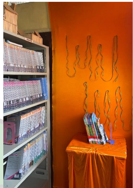
(Pojok baca moderasi beragama)