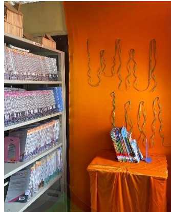
Gambar 1. Pojok Moderasi Beragama (Dokumentasi, 2024)