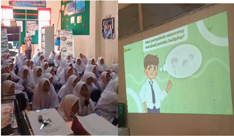
(Kegiatan Nonton bareng cerita pendek tema bullying)