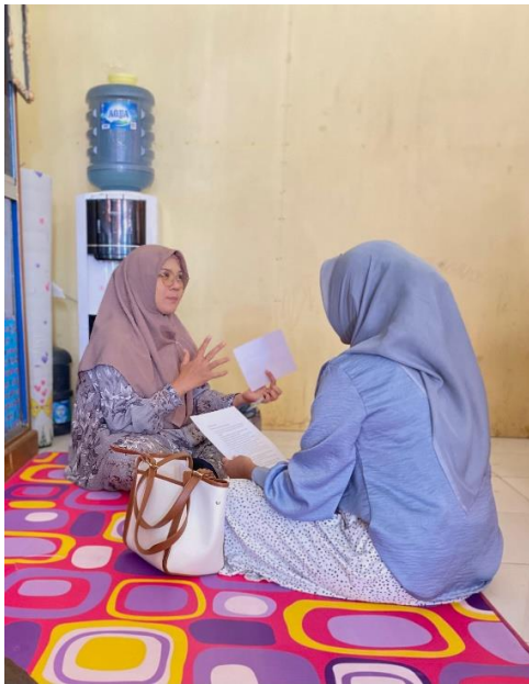
(Wawancara dengan pustakawan)