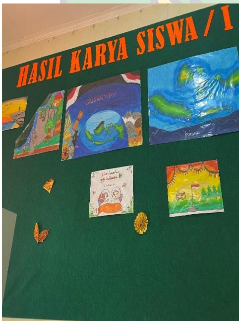
(Papan hasil karya siswa/i)