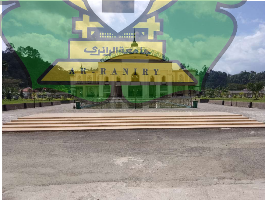
Gambar 1. 1 Masjid Agung Tengku Khalilullah Kabupaten Simeulue

Setiap kota memiliki tempat beribadah masing-masing yang dapat dijumpai oleh pengunjung. Kabupaten Simeulue merupakan kabupaten yang berada di bagian kepulauan Provinsi Aceh yang memiliki masjid terbesar di Kabupaten Simeulue yaitu Masjid Agung Tengku Khalilullah. Masjid ini terletak di pusat kota yang menjadi tempat wisata religi bagi masyarakat dari berbagai Kecamatan di Kabupaten ini dan masyarakat dari tempat lain.