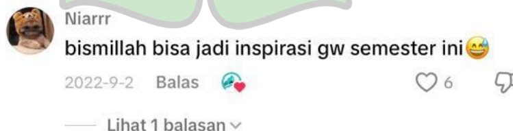
Gambar 3. Komentar akun @Niarr Pada konten Tiktok @hiracloud

Tabel diatas merupakan bentuk dari tema motivasi yang dituangkan netizen di kontennya. Komentar diatas merupakan hasil sampel dari 3 video yang dijadikan sampel dalam penelitian ini. Dilihat dari komentar di atas tidak sedikit netizen yang termotivasi mengerjakan skripsi, dapat disimpulkan netizen dapat termotivasi mengerjakan skripsi, bahkan konten yang dibuat tidak ada unsur dalam memotivasi menulis skripsi. peneliti melihat bahwasanya terdapat keterkaitan yang sangat relevan antara netizen dengan konten kreator tersebut. Komentar akun @Niarr membuktikan bahwa saya terdapat hubungan emosional yang sangat kuat, dikarenakan adanya hubungan atau kesamaan dalam mengerjakan skripsi. Netizen tersebut berkomentar di konten yang berjudul “Bagian 4| terror dosbing Skripsi sampe lulus dalam dua minggu yang upload pada tanggal 2 September 2022.