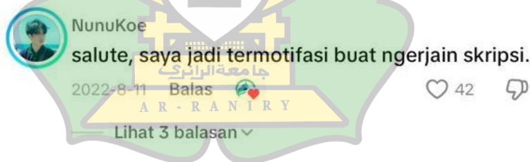
Gambar 4. Komentar akun @NunuKoe Pada konten Tiktok @hiracloud

Kemudian tema ini juga diperkuat dengan komentar dari akun @Nunukoe yang berkomentar di postingan yang berjudul "Bagian 1| ngerjain skripsi dalam 7 hari (Day7/7) upload pada tanggal 11 Agustus 2022. Dalam postingan akun @Nunukoe berkomentar bahwa, netizen tersebut mengakui salut dengan perjuangan akun@Hiraclod dalam mengerjakan skripsi. Beliau merasa termotivasi dalam mengerjakan skripsi.