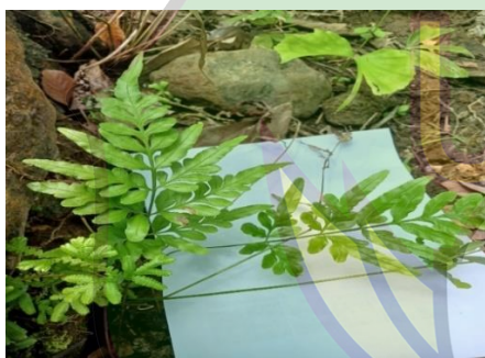
Gambar 8. Lygodium japonicum .

Lygodium japonicum ditandai oleh batangnya yang ramping, fleksibel, dan memanjang, dengan daun majemuk yang tumbuh berseling sepanjang batang, mencapai ukuran hingga beberapa meter. Daunnya berwarna hijau cerah, berukuran kecil, dan tepinya berlekuk menyerupai sirip atau pita.