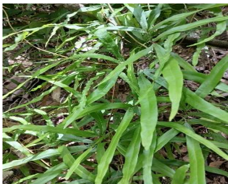
Gambar 7. Lygodium circinatum .

Klasifikasi Kingdom : Plantae Divisi : Pteridophyta Kelas : Polypodiopsida Ordo : Schizaeales Famili : Lygodiaceae Genus : Lygodium Spesies : Lygodium japonicum