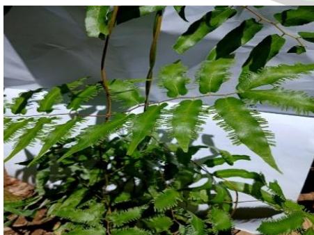
Gambar 9. Lygodium Volubile .

Lygodium volubile dikenal sebagai Paku resam, memiliki daun panjang menjalar dengan diameter 1,5-4 mm. Rimpang tua tampak halus, sementara apeksnya dipenuhi rambut tebal. Daun berwarna hijau menyirip dengan urat bebas dan permukaan yang licin, ujungnya berwarna hijau muda, berbentuk lancip, serta bertekstur mirip kertas.