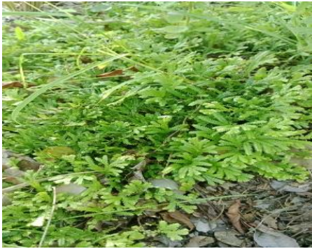
Gambar 16. Selaginella eurynota .

Klasifikasi Kingdom : Plantae Divisi : Lycopodiophyta Kelas : Lycopodiopsida Ordo : Selaginellales Famili : Selaginellaceae Genus : Selaginella Spesies : Selaginella eurynota