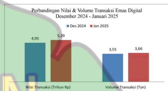
Gambar.2 Nilai dan Volume Transaksi Emas Digital