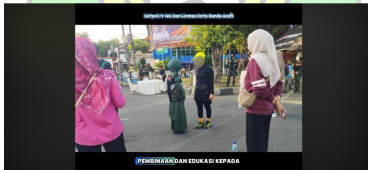
Gambar 3.3. Anggota Wilayatul Hisbah melakukan Pengawasan & Pembinaan pada Acara TARKAM FUN RUN 5KM SUMPAAH PEMUDA