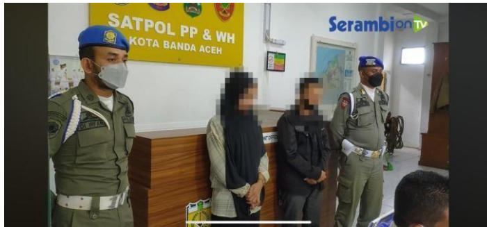
Gambar 3.2. Anggota Wilayatul Hisbah mengamankan pelaku pembuat konten tidak senonoh