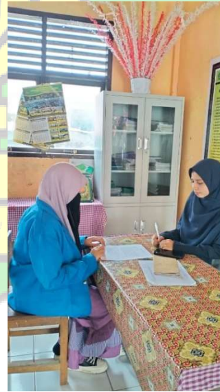
المقابلة مع مدرسة