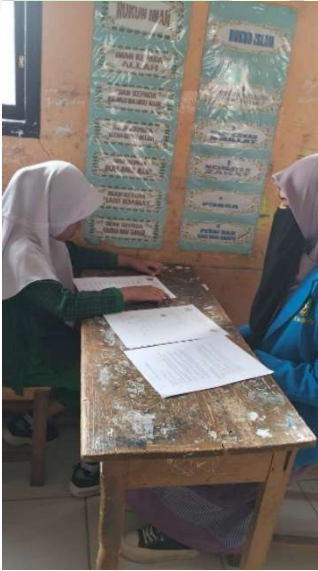
المقابلة مع التلاميذ