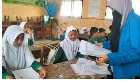
الباحث يوزع أوراق الإجابة