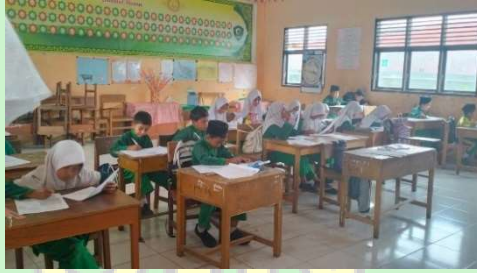
التلاميذ يجيبون عن أسئلة الامتحان