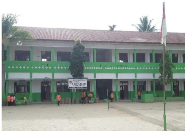
Foto tampak depan sekolah