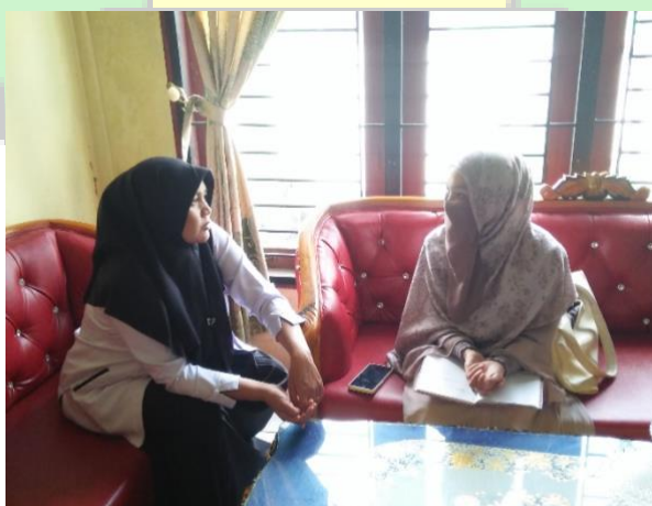
Wawancara dengan guru piket