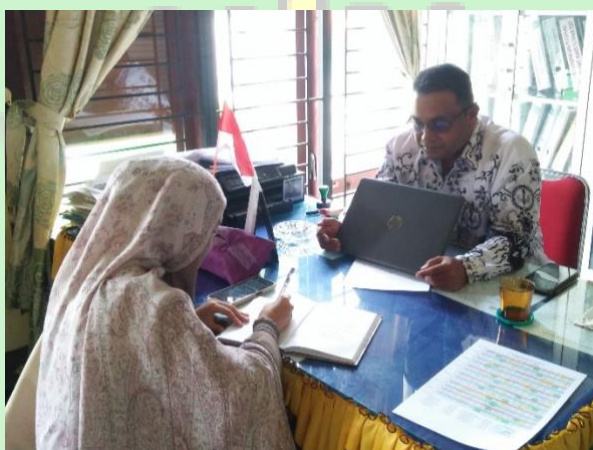
Wawancara dengan kepala sekolah