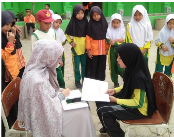
Tes bacaan surat pendek siswa