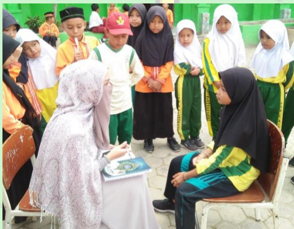
Wawancara dengan siswa