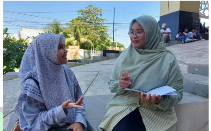
Wawancara bersama RN