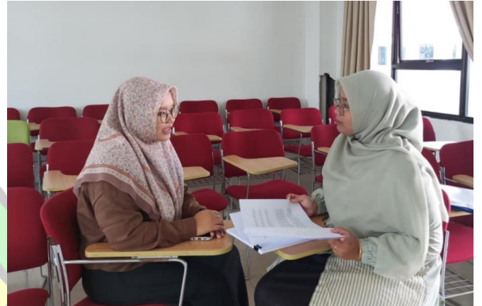
Wawancara bersama NU