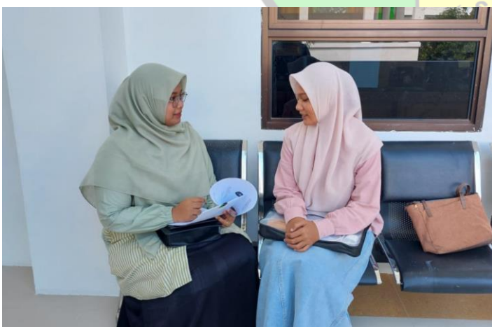
Wawancara bersama SD