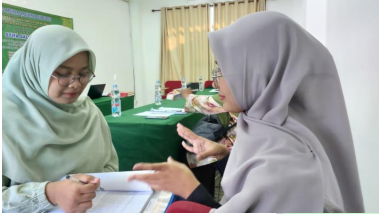
Wawancara bersama MH