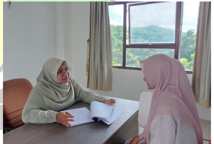
Wawancara bersama SAN