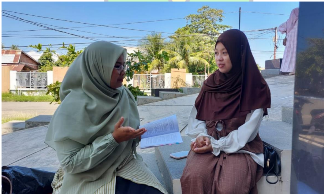
Wawancara bersama HN