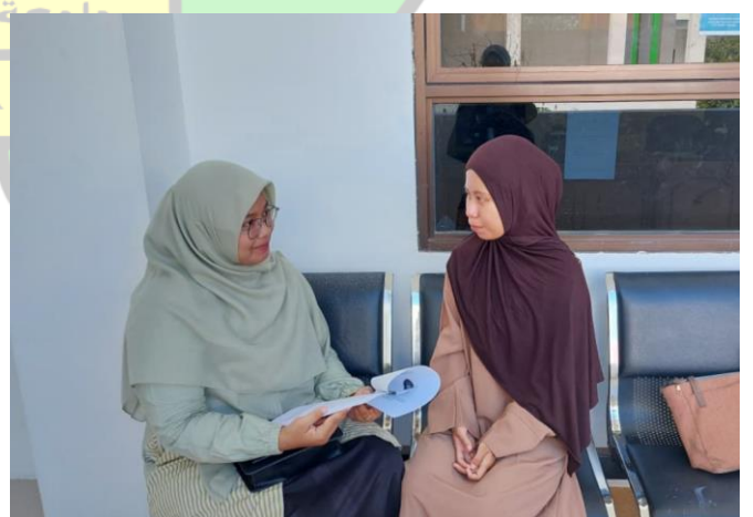
Wawancara bersama HS