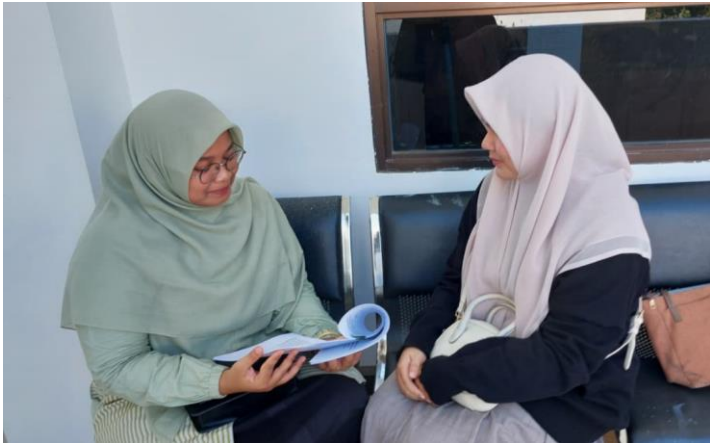
Wawancara bersama DM