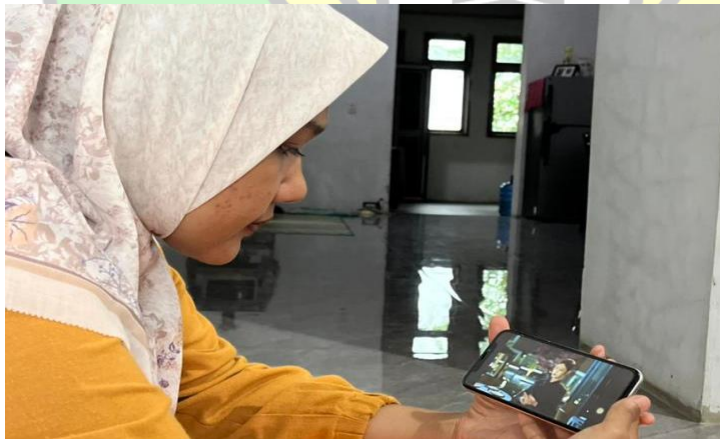
Gambar 4.1 Mahasiswa Prodi PAI saat menonton Drama Korea