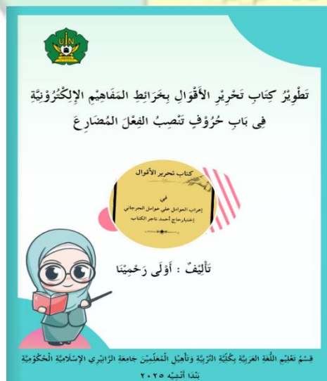
صورة ١,١ الغلاف الأمامي

استناداً إلى نتائج اختبار الصلاحية، حصل كتاب تحرير الأقوال القائم على الخرائط المفاهيمية الإلكترونية على متوسط درجة ٨٨,٥٪، وفقاً لمعايير صلاحية عالية جداً. وشمل التقييم مدى ملاءمة المحتوى، ودقة المفاهيم، والعرض المنهجي، وسلامة اللغة، وطريقة عرض الوسائط. وقد قُدمت بعض اقتراحات لتحسين المنتج وجعله أكثر فعالية في التعلم، وتمّ تنفيذ جميع التعديلات وفقاً لتلك التوجيهات. وبناءً على ذلك، يُعتبر هذا الكتاب صالحاً ومناسباً للاستخدام كوسيلة تعليمية. كما أكد الخبراء أن هذه الوسيلة شيقة وجذابة، مما يُسهّل على الطلاب فهم النحو. فيما يلي شكل كتاب تحرير الأقوال القائم على خرائط المفاهيم الإلكترونية :