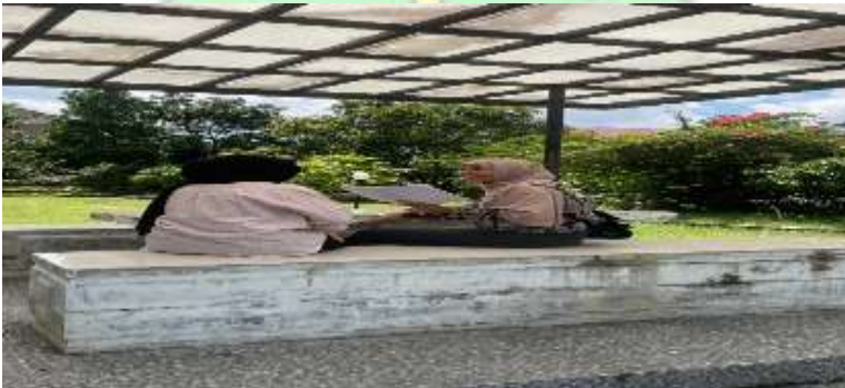
Wawancara Dengan Salah Satu Informan Mahasiswi Psikologi