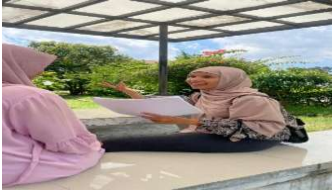
Wawancara Dengan Salah Satu Informan Mahasiswi Psikologi