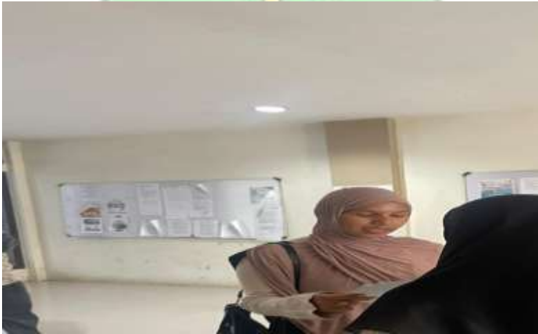
Wawancara Dengan Salah Satu Informan Mahasiswi Psikologi