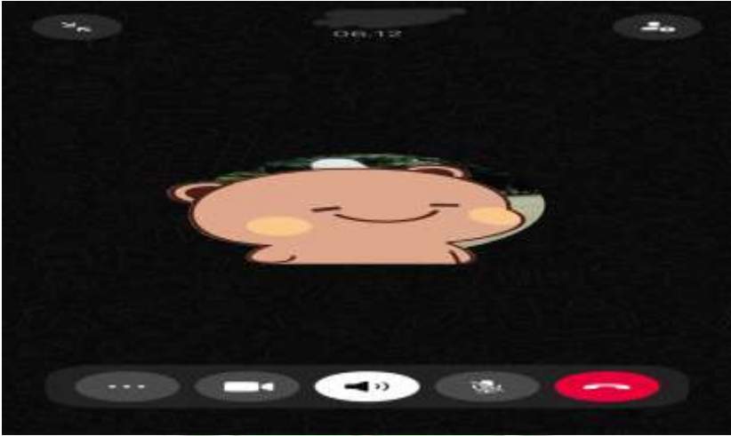
Wawancara Dengan Salah Seorang Mahasiswi Psikologi By Phone