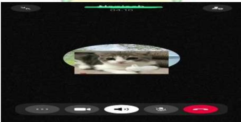
Wawancara Dengan Salah Seorang Mahasiswi Psikologi By Phone