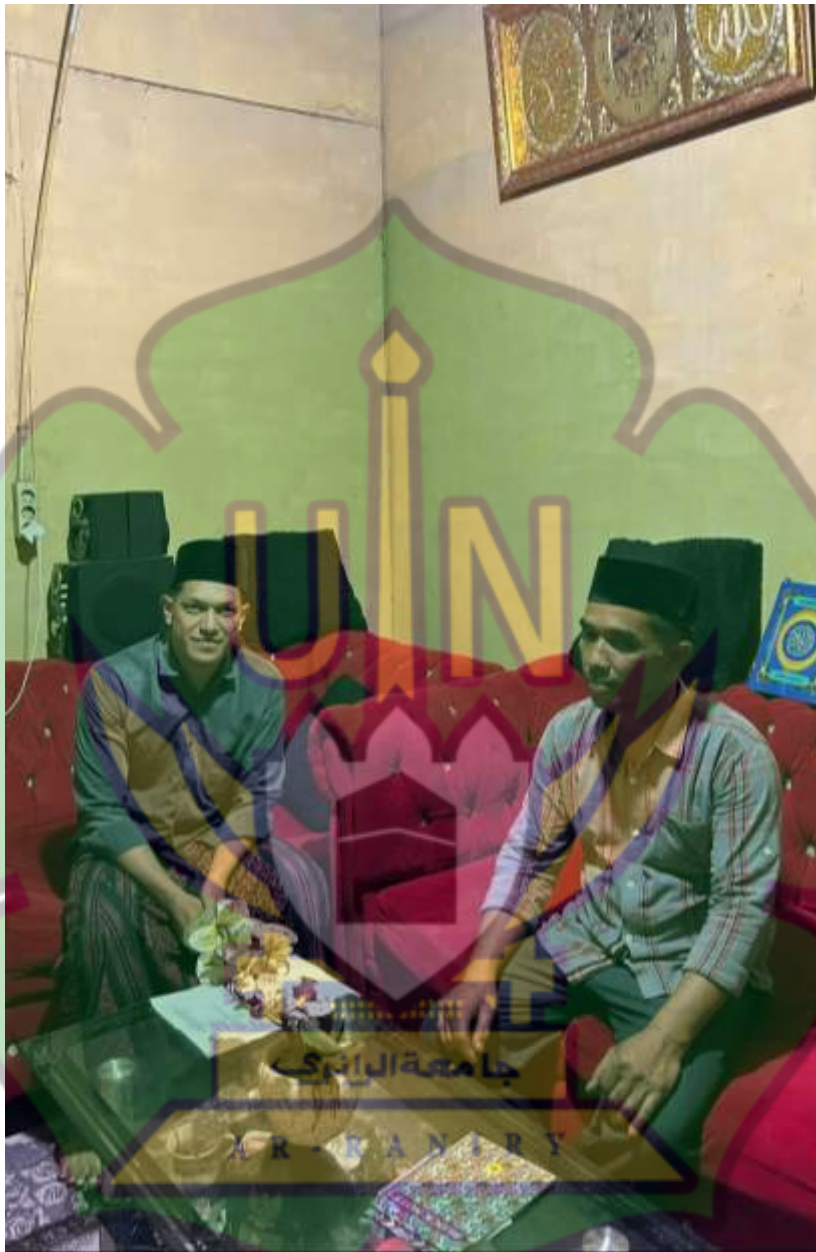
Dokumentasi wawancara dengan Reje (Kepala Desa) kampung Tawardi