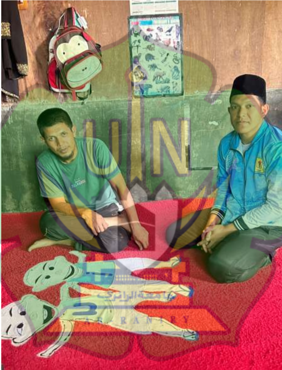
Dokumentasi wawancara bersama kepala desa kampung Tawardi