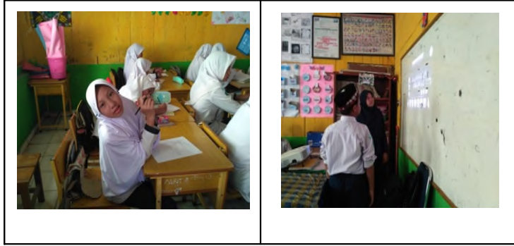
عملية تعليم وتعلم