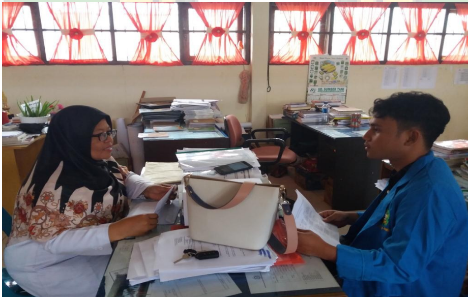
Gambar 2. Wawancara dengan Waka Humas