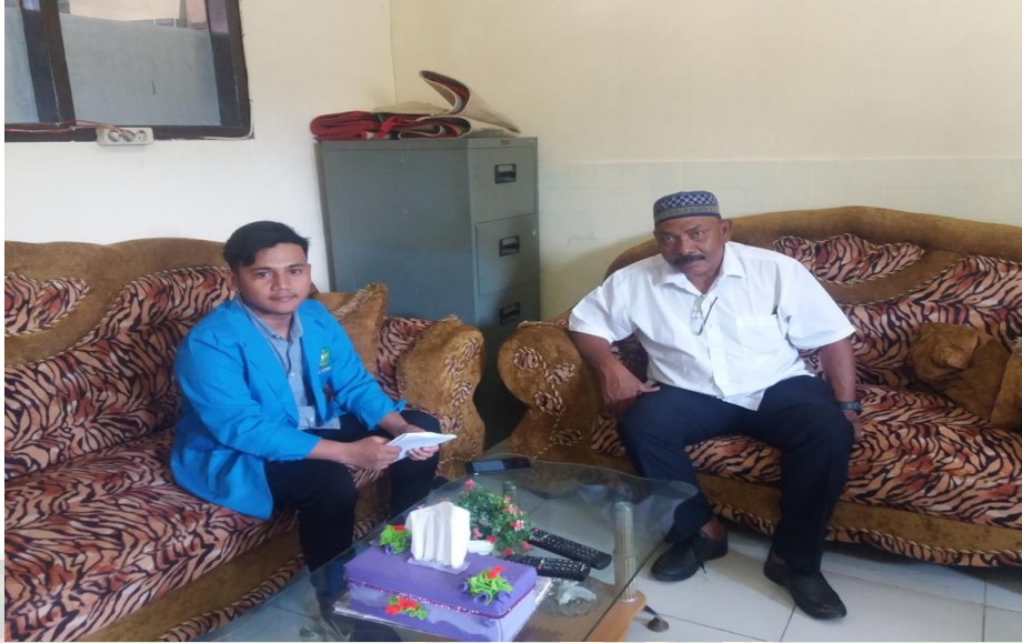
Gambar 1. Wawancara dengan Kepala Sekolah