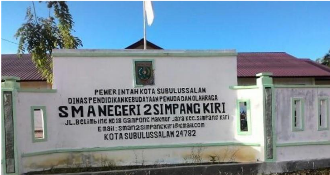
SMA Negeri 2 Simpang Kiri