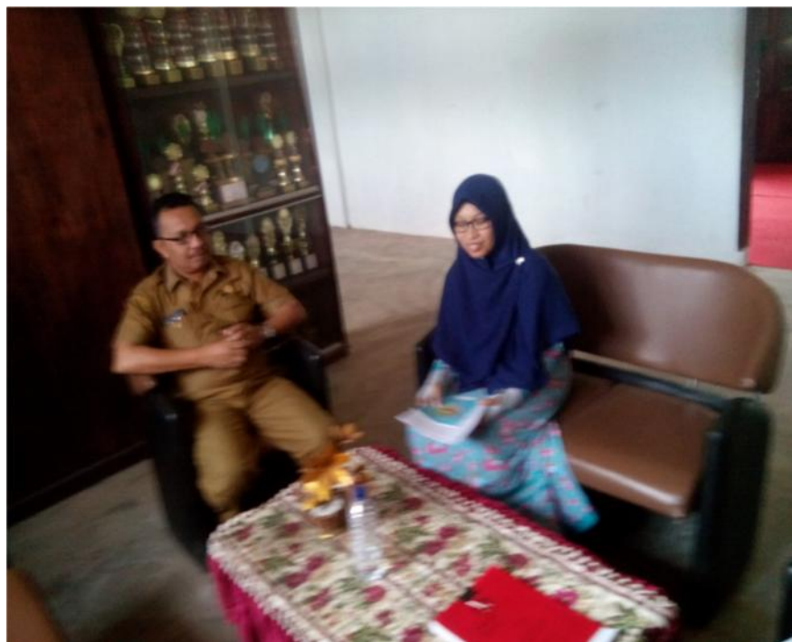
Wawancara dengan Kepala Sekolah SMA Negeri 2 Simpang Kiri