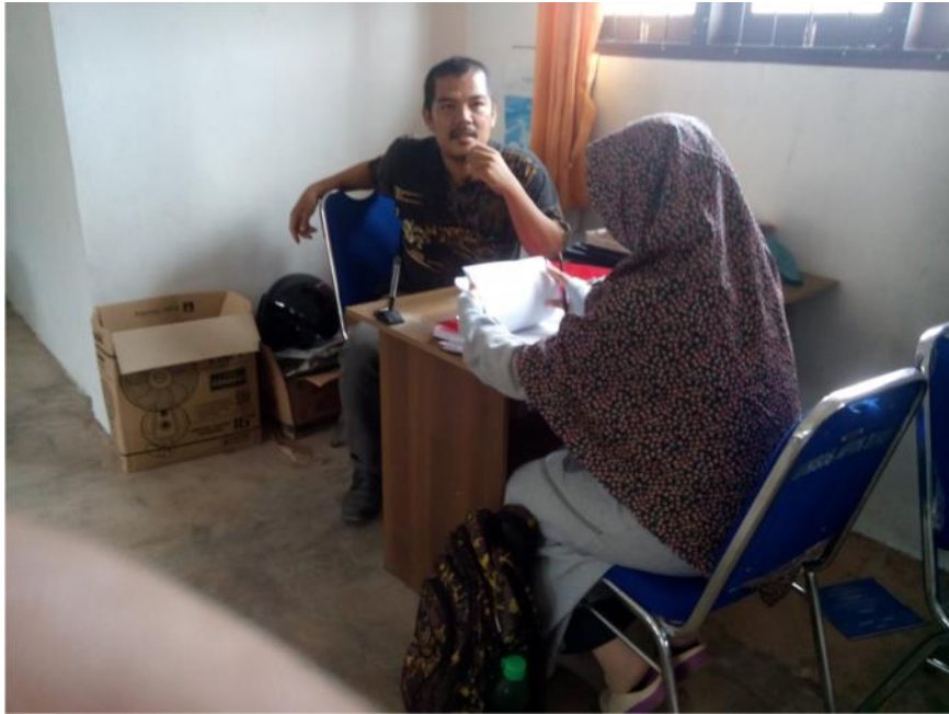
Wawancara dengan Guru Pendidikan Agama Islam