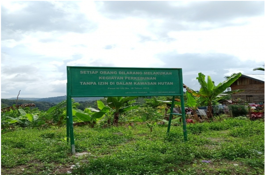
Gambar 1. Larangan melakukan kegiatan perkebunan