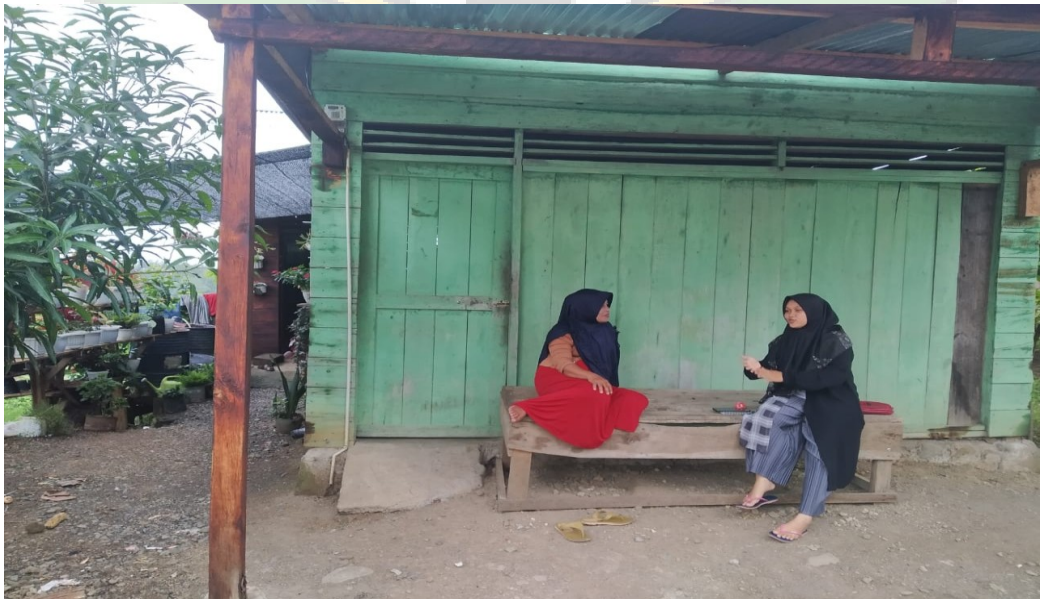
Gambar 6. Wawancara dengan masyarakat setempat