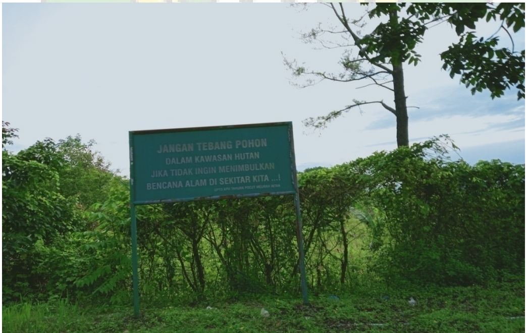
Gambar 2. Larangan menebang pohon