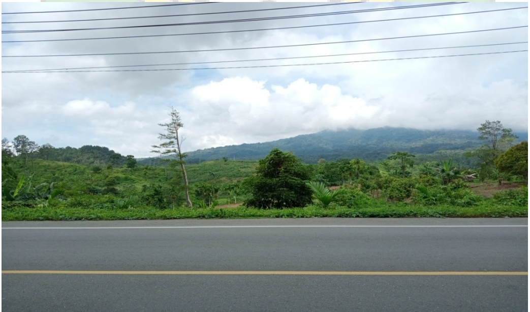
Gambar 4. Membuka lahan untuk perkebunan