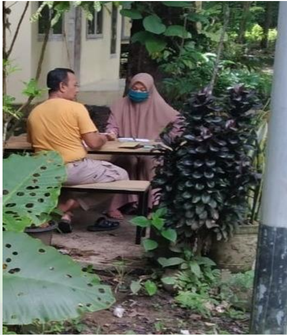
Gambar 5. Wawancara dengan pihak dinas kehutanan pocut meurah intan