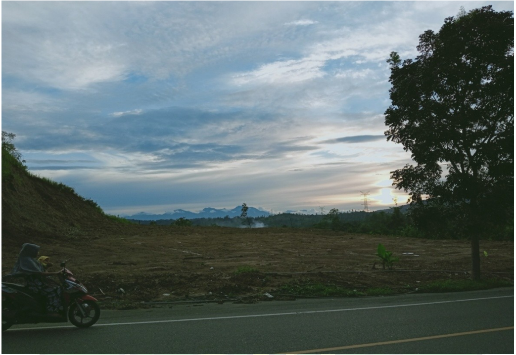
Gambar 3. Penebangan pohon