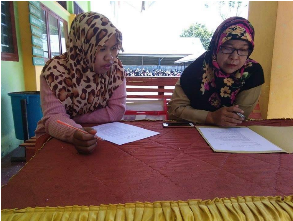
Gambar 2.7 kegiatan wawancara dengan guru