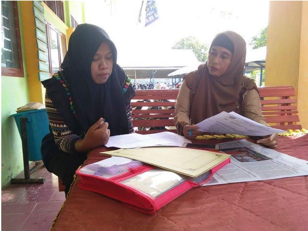
Gambar 2.4 kegiatan wawancara dengan guru