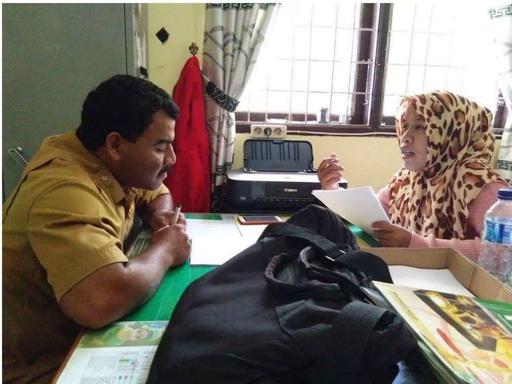
Gambar 2.9 kegiatan wawancara dengan guru