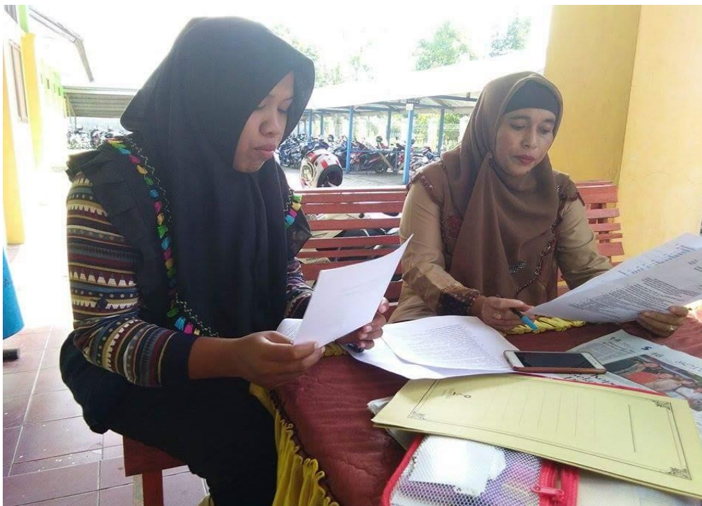
Gambar 2.5 kegiatan wawancara dengan guru