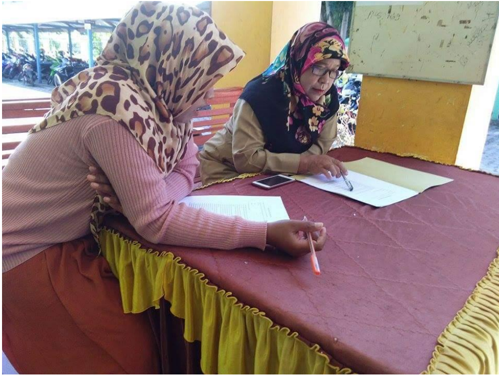
Gambar 2.6 kegiatan wawancara dengan guru