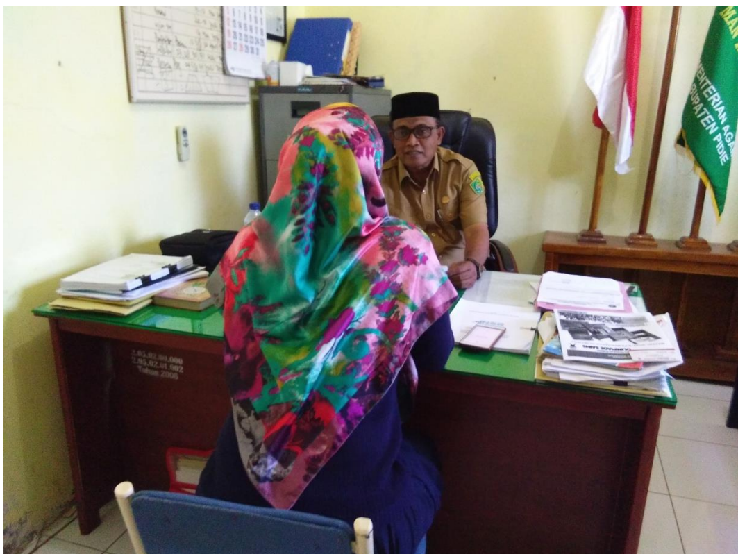
Gambar 2.3 kegiatan wawancara dengan kepala sekolah