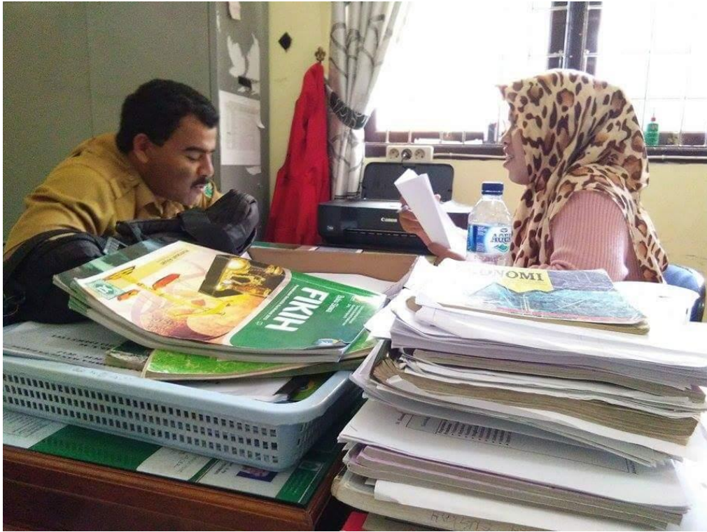
Gambar 2.8 kegiatan wawancara dengan guru