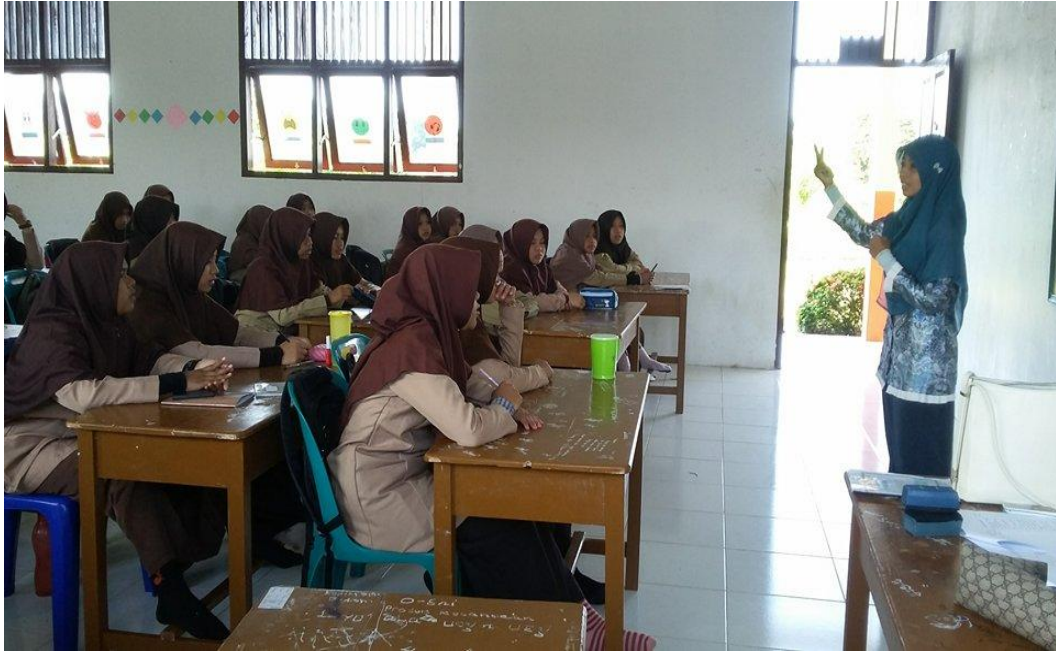
استماع الطالبات شرح الباحثة