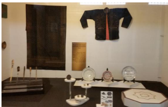
Foto petrin yang melambangkan kebesaran kerajaan Aceh, selain naskah juga terdapat mata uang emas dan juga asesoris baju kebesaran raja

Petrin berikutnya juga menunjukkan kehebatan Kerajaan Aceh yaitu gambaran tentang kebesaran sebuah kerajaan. Ada baju kebesaran yang diikuti dengan pernak pernik berupa keris kebesaran yang melambangkan kegagahan seorang raja jika keris tersebut digunakan bersamaan dengan baju dan kain yang dililitkan di pinggang si pemakainya, kemudian keris dipakai di pinggang bagian depan. Benda yang lain dipamerkan juga berupa mata uang emas Aceh. Kemudian ada juga alat tulis dan sekaligus dengan stempel kerajaan yang dikenal dengan cap sikureung .