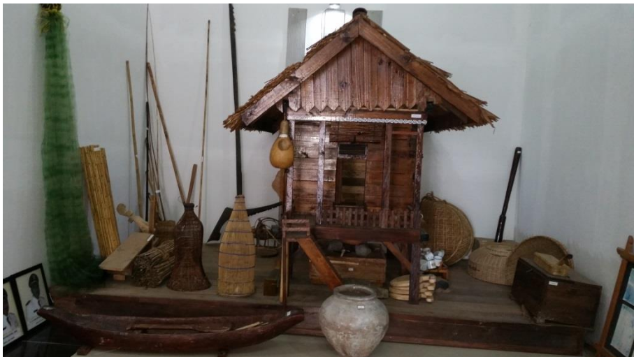
Foto 9. Rumah orang Gayo di kebun dan peralatan mencari ikan