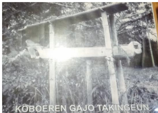
Foto kuburan gantung pada masyarakat Gayo

diikatkan di antara keempat tiang tersebut dan diletakkan mayatnya di dalam peti dan digantung di tengah hutan, jauh dari pemukiman masyarakat.