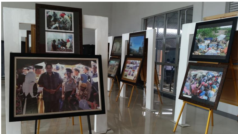
Foto-foto tentang kejadian gempa: foto depan tampak Presiden SBY datang berkunjung ke Kecamatan Ketol (lokasi terparah gempa)

Ruang 4 (empat) adalah ruang khusus gempa. Di sini terdapat berbagai informasi tentang gempa yang terjadi pada tahun 2013 yang lalu. Dimana pusat gempa berada di darat dan menghancurkan bangunan dan banyak juga korban berjatuhan karena tertimpa bangunan.