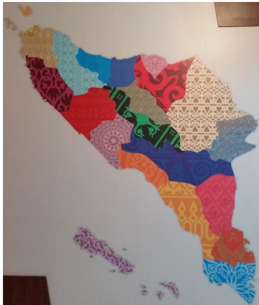
Gambar peta Provinsi Aceh yang dibubuhkan bermacam warna yang menunjukkan wilayah masing-masing kabupaten

Dari peta inilah digambarkan tentang potensi alam yang ada di Aceh, mulai dari potensi rempah-rempah yang menjadi sumber daya alam incaran penjajah pada masa kolonial. Orang-orang asing atau para penjajah dulunya tertarik dengan Aceh salah satunya adalah karena hasil alamnya berupa rempah-rempah seperti cengkeh, pala, kemiri, lada dan beberapa hasil bumi lainnya. Rempah-rempah tersebut dipajang di dalam stoples kecil dan diatur selang-seling, sehingga tampak indah dan menarik untuk dilihat. Di bagian depan stoples ditaruh tulisan identitas rempahnya.