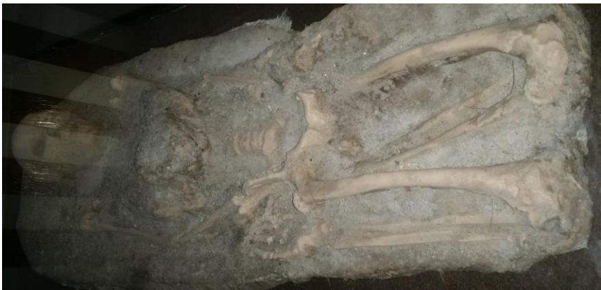
Foto kerangka manusia prasejarah, posisi kaki dilipat pada saat penguburan

Ruang berikutnya atau penulis menyebutnya ruang 2 (dua) berisi benda-benda prasejarah yang ditemukan oleh Balar Medan pada tahun 2012. Mereka melakukan ekskavasi dan menemukan berbagai peralatan dan tengkorak manusia prasejarah. Tengkorak ini sudah diteliti dan manusianya telah berusia 500-800 tahun yang lalu. Hal ini mengejutkan peneliti, sehingga disimpulkan sementara bahwa manusia tertua di Aceh ada di situs Mendale, Takengon.