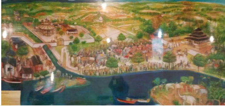
Foto gambar sketsa penataan ruang seperti yang tergambar dalam kitab Bustan as-salatin

Ilustrasi gambar tersebut menunjukkan bahwa keadaan wilayah di sekitar istana tampak sudah tertata. Tampak dalam lukisan ada masjid, dermaga, istana, ruang-ruang terbuka untuk umum, ada pohon-pohon di antara bangunan, pemukiman penduduk dan lain-lain yang menunjukkan bahwa pusat kerajaan sudah menjadi sebuah pusat kehidupan yang mapan.