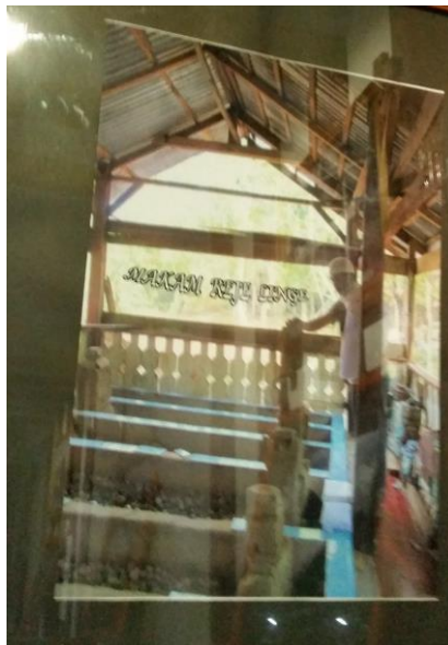
Foto makam di situs Linge bekas Kerajaan Linge terdapat di ruang 1

Di ruang ini mencoba untuk memamerkan jejak sejarah dan juga budaya masyarakat Gayo yang berada di pesisir Danau Laut Tawar. Pada saat masuk, di sebelah kiri dinding terdapat foto makam Kerajaan Linge. Makam tersebut diletakkan paling depan membuktikan bahwa masyarakat Gayo sudah lama masuk Islam, terbukti dengan adanya nisan kuno yang terletak di situs Linge.