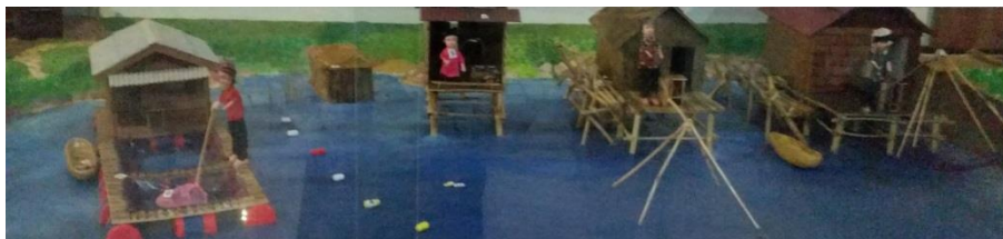
Foto 6. Aktivitas Budidaya Ikan di Danau Laut Tawar