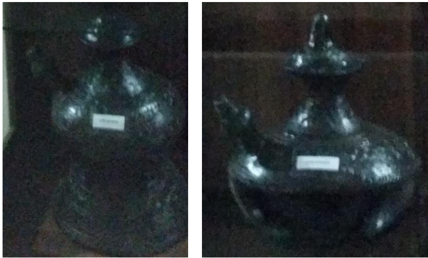
Foto kendi yang sebelah kiri untuk laki-laki dan sebelah kanan untuk perempuan

Benda-benda yang disajikan di ruang 1 (satu) ini menggambarkan kehidupan masyarakat Gayo, mulai dari masa pra Islam dengan faktanya ada kuburan gantung. Kemudian diikuti dengan kehidupan masa kerajaan Islam dibuktikan dengan adanya raja-raja yang memimpin pada masa kerajaan Islam. Ditambah lagi dengan keberadaan foto makam Kerajaan Linge di situs Linge. Faktanya bahwa tipe nisannya sudah memiliki bentuk seperti umumnya nisan yang tersebar di pesisir Aceh seperti Banda Aceh, Aceh Besar dan wilayah lainnya, serta ornamen dengan hiasan floral dan tulisan kalimah-kalimah Allah pada ukiran kaligrafinya. Di ruang ini juga dipamerkan tentang kebudayaan orang Gayo yang termasuk tujuh unsur kebudayaan secara umum termasuk aktivitasnya.