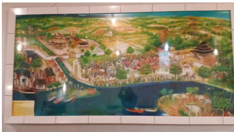
Sketsa gambar yang mengilustrasikan kota pada masa kesultanan Aceh Darussalam dalam kitab Bustan as-salatin

Namun, di awal cerita, kurator meletakkan tulisan “bustan as-salatin”. Di depan tulisan bustan as-salatin terpampang dengan besar sketsa gambar yang mengilustrasikan kota pada masa kesultanan Aceh Darussalam yang terdapat di dalam kitab Bustan as-salatin. Jika orang telah membaca kitab tersebut, maka akan timbul banyak pertanyaan bahwa mengapa benda-benda yang dipajang ada yang tidak sesuai dengan cerita dalam kitab tersebut seperti diletakkannya makam Sultan Malik as-Saleh, kemudian adanya foto perkembangan masjid di Aceh mulai yang tradisional sampai masjid modern. Hal terungkap ketika dilakukan wawancara dengan kurator, dan kurator merasa sangat berhasil dengan hasil karyanya karena dapat mengecoh pemikiran pengunjung.