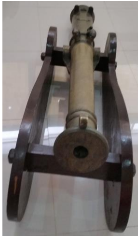
Foto meriam Lada Sicupak yang diberikan oleh Kerajaan Turki

Banyaknya terjadi peperangan dan tidak seimbangya peralatan senjata, maka Turki sebagai negara yang mendukung Aceh mengirimkan meriam kepada Kerajaan Aceh sebagai senjata yang dapat menyeimbangkan peralatan perang musuh yaitu Meriam Lada Sicupak.