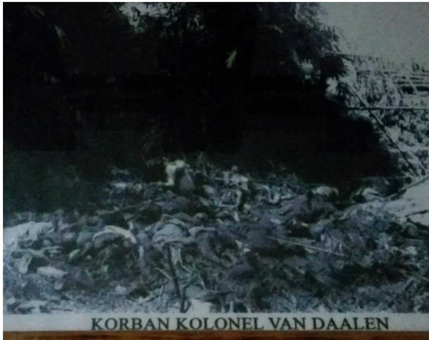
Foto 8. Korban colonel Van Daalen yang membunuh orang Gayo terutama anak-anak dan perempuan