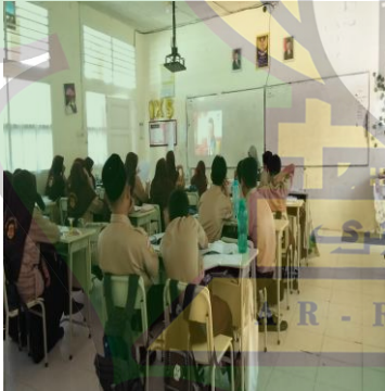
صورة الطلبة عند إجابة الأسئلة