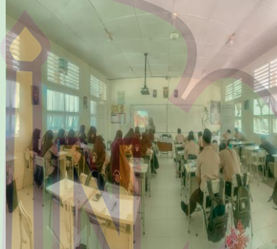
صورة الباحثة عندما تشرف الطلبة في مشاهدة الأفلام