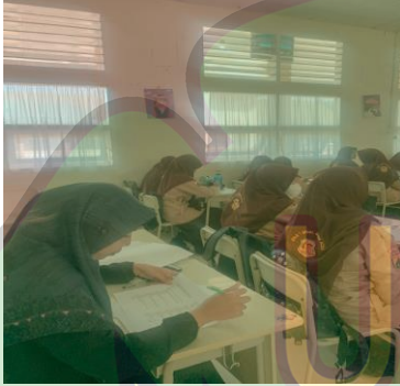
صورة الملاحظة عندما تملأ ورقة الملاحظة