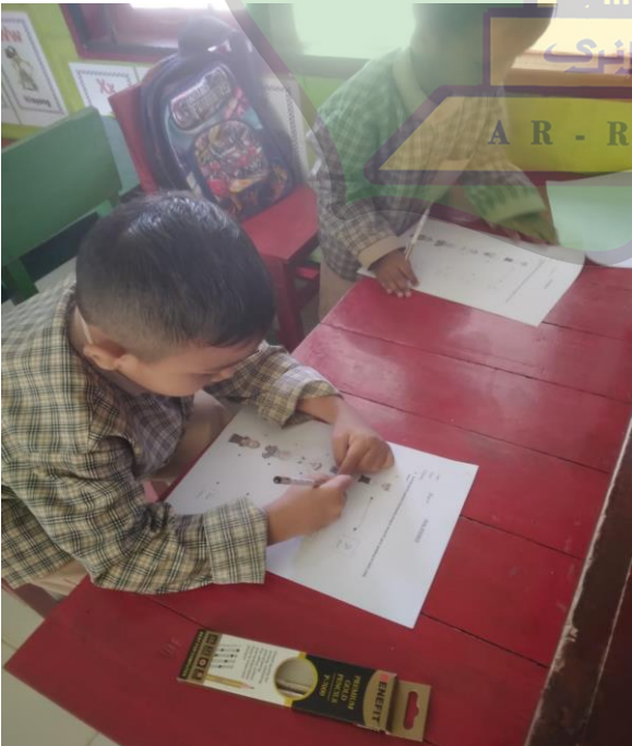
الصورة أثناء إجابة الاختبار القبلي