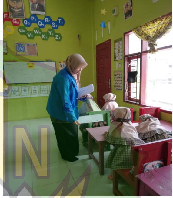
الصورة أثناء تقسيم الاختبار