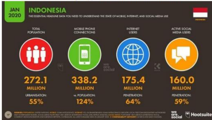
Gambar 1. Jumlah pengguna internet Indonesia Tahun 2020