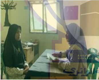
صورة الباحثة عندما تقابل طالبة عن مشكلات تعلم البلاغة