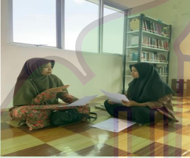
صورة الباحثة عندما تقابل معلمة البلاغة عن مشكلات الطالبات في تعلم البلاغة