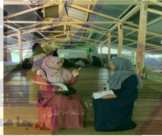
صورة الباحثة عندما تقابل معلمة البلاغة عن محاولاتها لحل مشكلات الطالبات في تعلم البلاغة