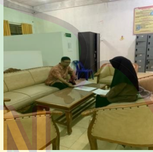
صورة الباحثة عندما تقابل نائب مدير معهد دار الإحسان