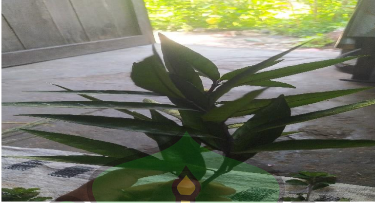
Gambar 2.0 Tumbuhan Bebesi