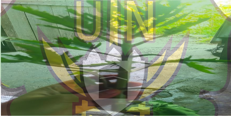
Gambar 2.1 Tumbuhan Dedingin