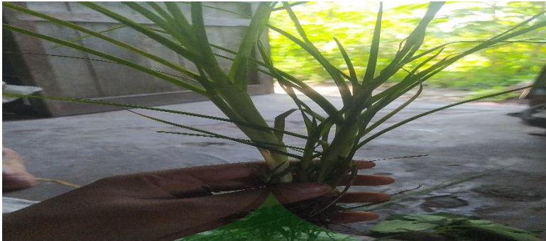
Gambar 1.7 Tumbuhan Teteguh