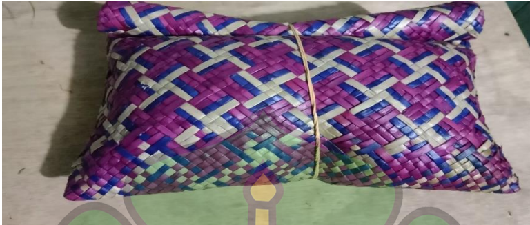
Gambar 1.1 Oros senare was tape

3. Bagaimana jika ada yang melaksanakan acara tetapi dia tidak datang untuk Nengon Lo Jeroh?