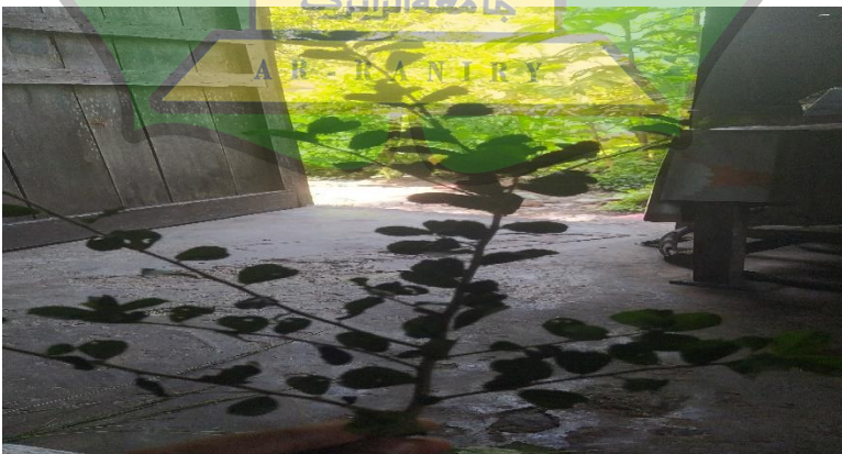
Gambar 1.6 Tumbuhan Jejerun