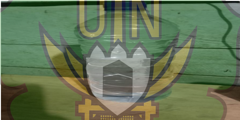
جامعة الرانيري Gambar 1.2 Waih was botol AR - RANIRY