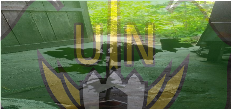
Gambar 1. 8 Tumbuhan Pelulut