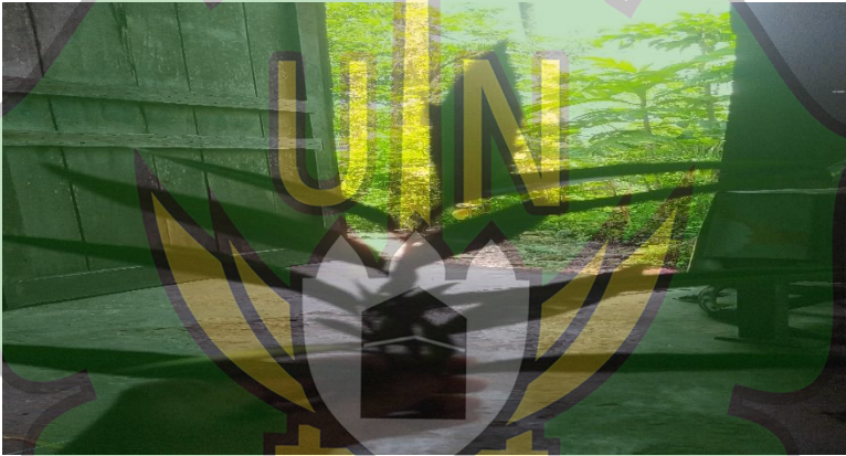
Gambar 1.5 Tumbuhan Sempilit