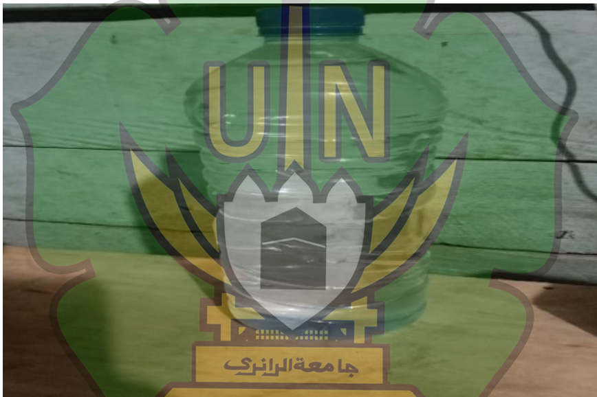
Gambar 1.2 Waih Was Botol atau Ceret

Seperti yang diketahui, ceret atau teko atau botol sering digunakan sebagai wadah tempat air, dan pada setiap rumah pasti memiliki ceret /teko/botol untuk wadah tempat air. Pada tradisi nengon lo jeroh untuk pindah rumah waih was ceret atau Botol memiliki makna agar yang menempati rumah tersebut memiliki kebijaksanaan, ketenangan, dan kesabaran dalam menghadapi kehidupan.