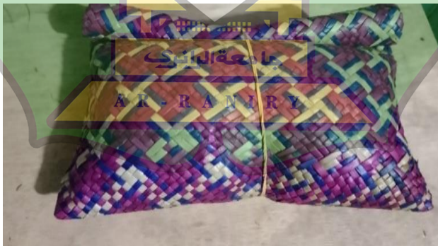
Gambar 1.1 Oros Senare Was Tape