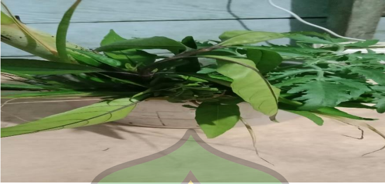
Gambar 1.4 Tepung tawar