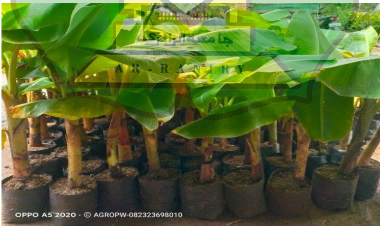
Gambar 1.9 Tumbuhan Anak Pisang Kepok