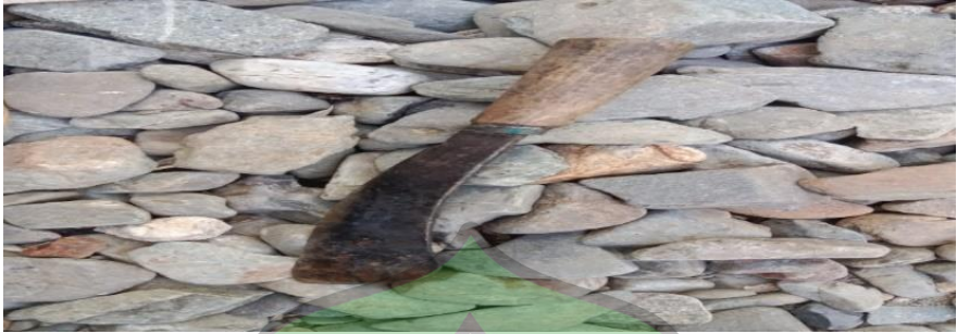
Gambar 1.3 Dubang (Parang)

Parang seringkali digunakan oleh masyarakat Kute Cinta Damai sebagai alat untuk memasak (seperti memotong daging, dan sayuran) dan alat berkebun (seperti memotong kayu, mengupas coklat atau kakau, tebas rumput dan lain-lain). Pada tradisi nengon lo jeroh parang memiliki makna teger semangat atau semangat yang kuat dan keberanian dalam menghadapi bahaya dan melawan ketakutan.