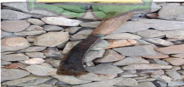
Gambar 1.3 Dubang