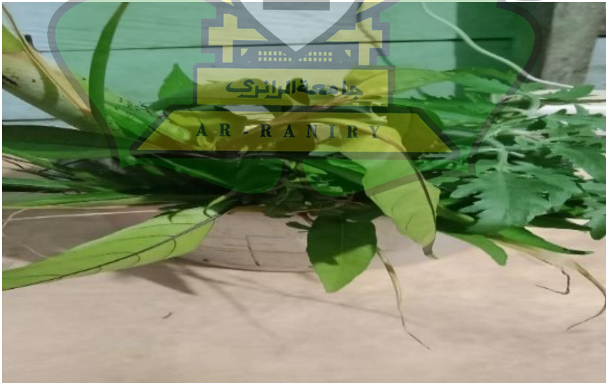
Gambar 1.4 Tepung Tawar