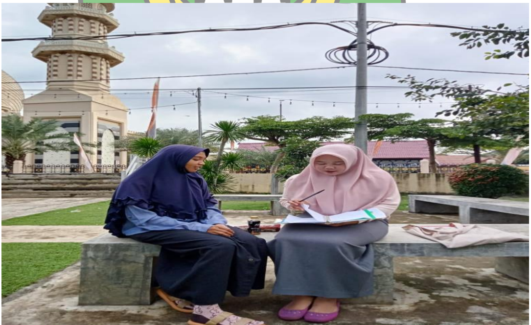
Wawancara dengan mitra Pembeli UMKM Kaalesta Official Lueng Bata di Kota Banda Aceh, Tanggal 18 Desember 2023.