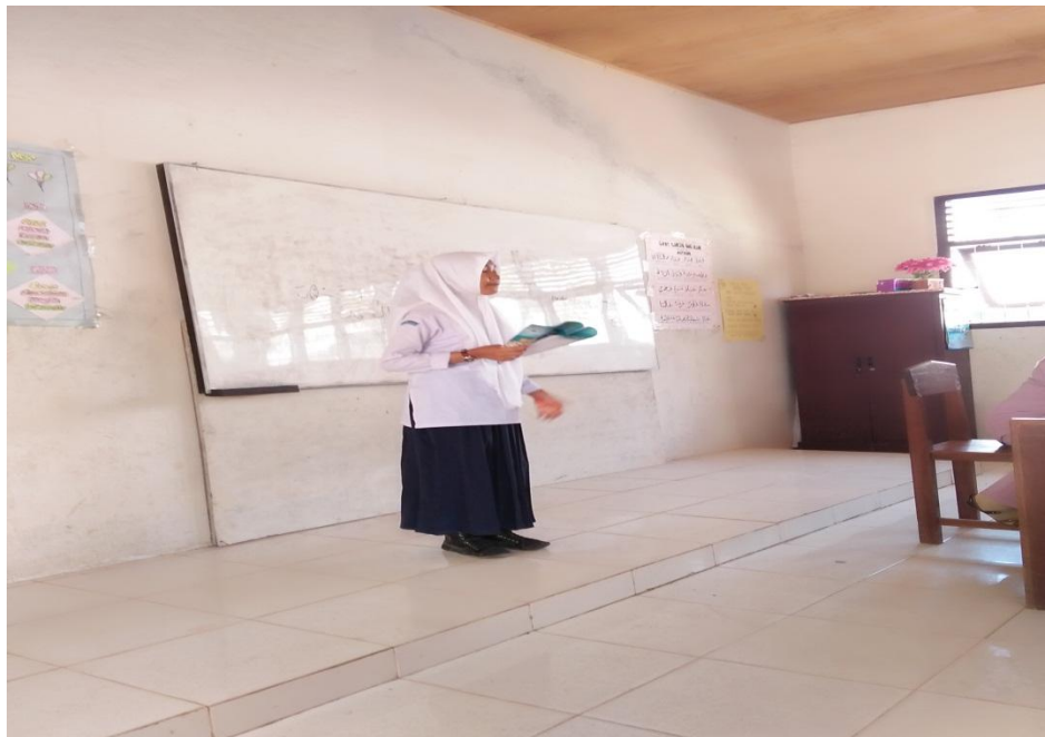
Siswa sedang melakukan presentasi hasil kerjanya