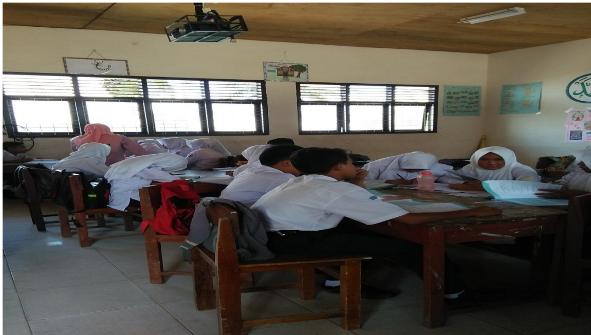
Guru membantu siswa dalam Melakukan investigation