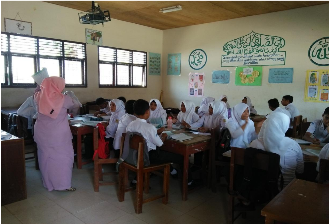
Perhatian siswa saat mendengarkan penjelasan guru