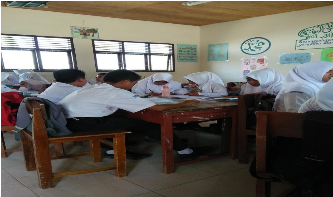
Siswa melakukan Investigasi dalam Kelompok