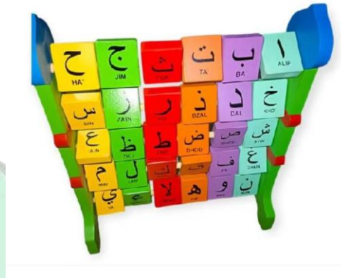
Gambar 1.1 Wooden Toys Hijaiyah

Wooden toys hijaiyah yang dimaksud dapat di lihat pada Gambar 1.1.