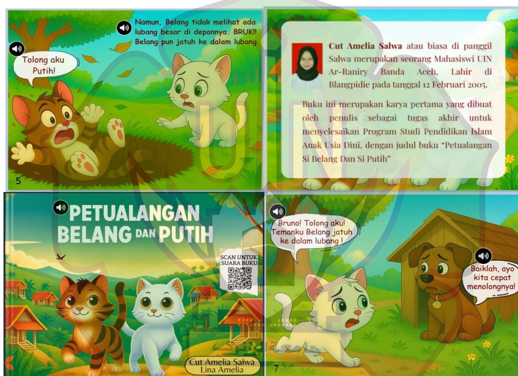
Gambar 3. E-book Setelah Revisi

Pengembangan yang dilakukan setelah revisi yaitu : 1) Menambahkan elemen audio pada setiap dialog dan bagian cerita dalam buku. Penambahan suara ini bertujuan untuk meningkatkan pengalaman membaca interaktif serta membantu pembaca, khususnya anak-anak, dalam memahami isi cerita dengan lebih baik, 2) Pengembangan kedua dilakukan pada aspek karakter visual, yaitu dengan menyeragamkan karakter kucing agar memiliki tampilan yang konsisten di setiap halaman buku. Perubahan ini bertujuan untuk meningkatkan kesinambungan visual serta memperkuat identitas karakter dalam keseluruhan cerita.