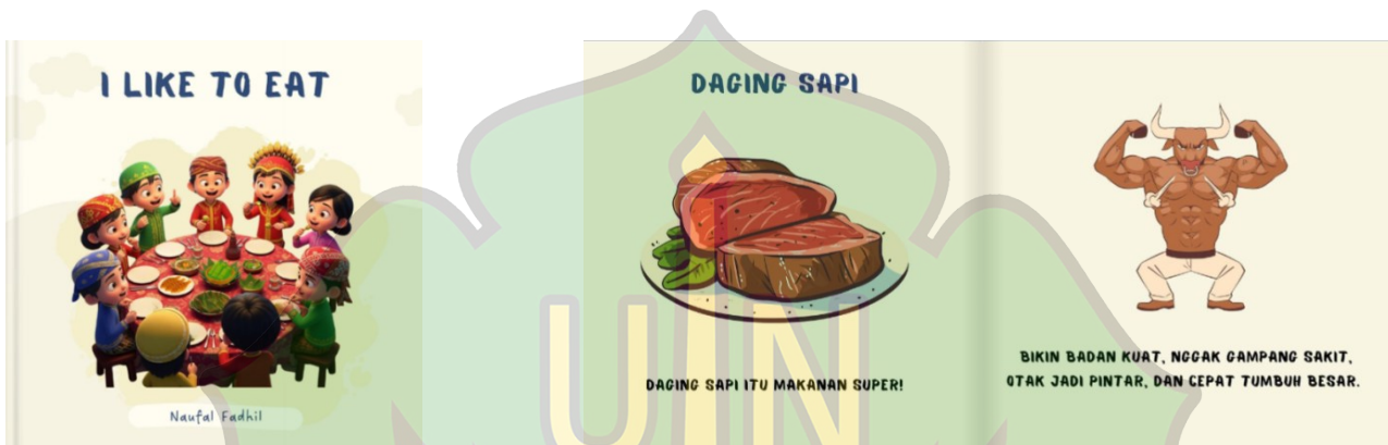
Gambar 2. E-book Sebelum Revisi

Tahap pengembangan adalah proses mengubah rancangan atau spesifikasi desain menjadi bentuk produk yang nyata dan dapat digunakan (Fitriyah et al., 2021). Pada tahap ini dilakukan proses pengembangan e-book "I Like To Eat" serta penyusunan instrumen untuk uji kelayakan oleh ahli media dan ahli materi. Pada tahap ini, e-book masih memerlukan sejumlah perbaikan berdasarkan hasil penilaian dari kedua ahli tersebut. Pada awal penulisan e-book "I Like To Eat" ini berlangsung selama dua minggu, tahap pengembangan diawali dengan membuat cover cerita sampai biodata penulis menggunakan aplikasi Canva.com dan Book Creator . Hasil pengembangan e-book dapat dilihat pada Gambar 2 dan Gambar 3.