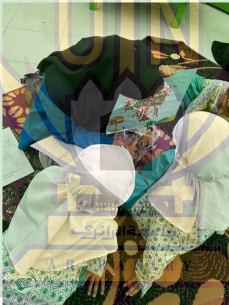
Gambar 2. Kegiatan Menjelaskan Cara Main Media Monkey Math Tree

Pada kegiatan pertama dilakukan dengan mengajak anak bermain menggunakan media Monkey Math Tree untuk melihat kemampuan awal mereka dalam numerasi. Pada tahap ini, anak diberi kesempatan untuk berinteraksi dan tanpa adanya bimbingan khusus, sehingga peneliti dapat mengamati sejauh mana pemahaman anak terhadap konsep bilangan, kemampuan menghitung, serta kecakapan mencocokkan jumlah benda dengan sesuai angka