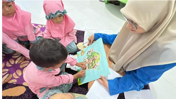
Gambar 1. Bermain Media Monkey Math Tree

terhadap kemampuan numerasi anak di TKIT Baitusshalihin di Ule Kareng berdasarkan hasil penelitian.