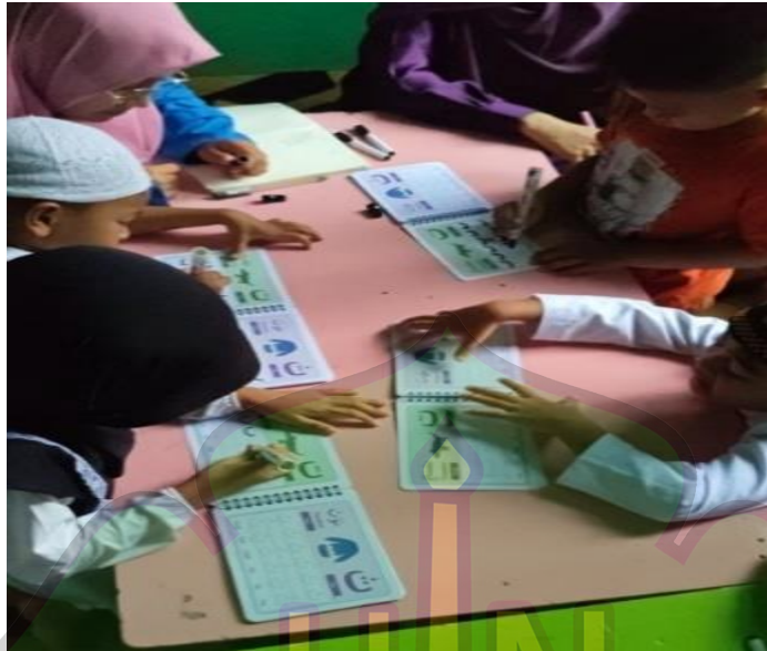
Gambar 2. Kegiatan meniru huruf hijaiyah pada media Smart work book (wipe&clean)

Kegiatan hari pertama dan kedua adalah anak memilih huruf hijaiyah dan menempel huruf hijaiyah di karton yang telah disediakan sesuai dengan huruf yang sudah ada di karton.