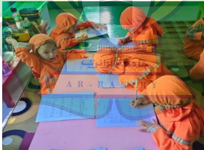
Gambar 3. Kegiatan posttest meniru huruf hijaiyah pada Lembar Kerja Anak (LKA)

Kegiatan hari ketiga adalah kegiatan treatment yaitu melakukan kegiatan penerapan media kepada anak yaitu media smart work book (wipe & clean) .