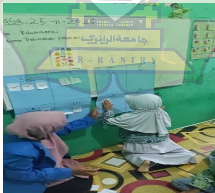
Gambar 1. Kegiatan Menempel Huruf Hijaiyah

Pengenalan huruf hijaiyah pada anak sangat penting diajarkan, mulai dari pengucapan dan penulisannya. Senada dengan kajian Zainiyah, yang menyatakan bahwa pengenalan huruf hijaiyah sejak usia dini, termasuk pengembangan kemampuan anak untuk mendengar, mengucapkan, dan menulis berbagai huruf hijaiyah [24]. Pengenalan huruf hijaiyah pada anak di sekolah RA Ahlul Qur'an semakin terlihat kemampuannya setelah dibuktikan dengan hasil yang diperoleh pretest dan posttest . Hasil rata-rata dari pretest berjumlah 2,18 dan nilai posttest berjumlah 2,85. Maka terbukti bahwa media smart work book (wipe & clean) dapat digunakan untuk mengenalkan huruf hijaiyah pada anak usia 4-5 tahun di RA Ahlul Quran berdasarkan penelitian yang sudah dilakukan. Dokumentasi penelitian dapat dilihat pada gambar berikut ini: