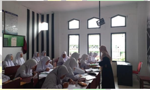
اختبار البعدي والاستبانة