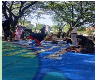
Gambar 2. Kegiatan baca rame rame