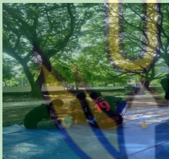
Gambar 3. pemilihan buku bacaan usia