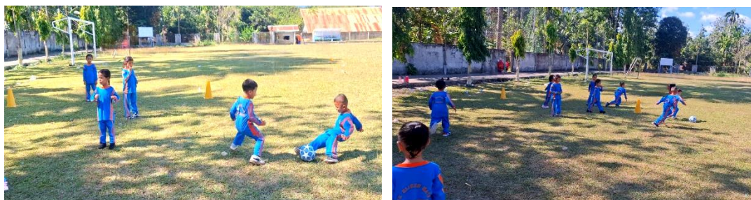
Gambar 3. Kelincahan anak dalam mengambil bola.