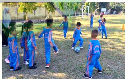
Gambar 2. Permainan sepak Bola modifikasi.