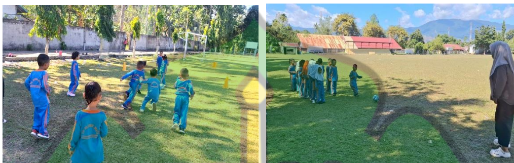
Gambar 4. Koordinasi mata kaki anak dalam menendang bola kearah yang dituju.