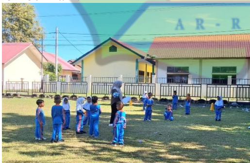
Gambar 1. Pembagian Kelompok kecil

Proses pembelajaran dimulai dengan pemanasan yang menyenangkan seperti senam dulu sebelum melakukan permainan sepak bola modifikasi, selanjutnya diikuti dengan penjelasan aturan permainan yang disederhanakan agar mudah dipahami oleh anak-anak. Anak-anak kemudian di bagi menjadi dua kelompok kecil dan bermain sepak bola dengan modifikasi aturan (misalnya, ukuran bola yang lebih kecil, lapangan yang lebih kecil, jumlah pemain nya lebih sedikit, dan menggunakan gawang dengan ukuran lebih kecil). Selama sesi permainan guru berperan sebagai fasilitator yang memberikan bimbingan konstruktif, dukungan emosional anak, serta mendorong interaksi positif antara anak-anak. Hasil penelitian menunjukkan peningkatan nyata dalam berbagai aspek motorik kasar anak-anak, mereka menunjukkan peningkatan kelincahan yang signifikan, mampu melakukan gerakan lari cepat dan perubahan arah dengan lebih mudah, kekuatan kaki mereka juga meningkat, koordinasi mata dan kaki mereka juga menjadi lebih halus, meningkatkan mereka untuk mengiring bola dengan kontrol yang lebih baik. Selain itu, keseimbangan tubuh mereka juga meningkat, memungkinkan mereka untuk melompat dan mempertahankan posisi dengan lebih stabil. Modifikasi aturan dan peralatan dalam permainan sepak bola terbukti menjadi kunci keberhasilan dalam memfasilitasi perkembangan keterampilan motorik kasar anak-anak. Modifikasi ini memungkinkan mereka untuk berpartisipasi aktif, merasakan pencapaian, dan menikmati proses belajar sambil bermain.