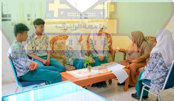
Gambar 1.9 suasana ruang BK SMA Negeri 9 Banda Aceh Peserta didik di arahkan oleh guru BK SMA Negeri 9 Banda Aceh

Ruang bimbingan dan konseling di SMA Negeri 9 Banda Aceh menjadi fasilitas penting dalam mendukung perkembangan siswa. Ruangan ini digunakan untuk memberikan layanan konseling akademik maupun pribadi. Suasana ruang konseling cukup nyaman dan kondusif untuk komunikasi. Guru BK memanfaatkan fasilitas ini untuk membantu siswa mengatasi permasalahan belajar. Keberadaan ruang BK mendukung pembinaan karakter dan mental siswa. Hal ini berkontribusi pada terciptanya lingkungan belajar yang positif.