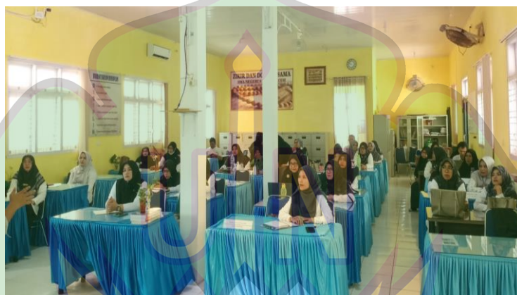
Gambar 1.5 suasana ruang guru di SMA Negeri 9 Banda Aceh

Fasilitas penunjang lainnya adalah ruang guru yang digunakan sebagai tempat bekerja dan berdiskusi antar pendidik. Ruang guru dilengkapi dengan meja kerja dan lemari penyimpanan dokumen. Lingkungan ruang guru cukup nyaman dan kondusif. Fasilitas ini mendukung koordinasi antar guru dalam merencanakan pembelajaran. Selain itu, terdapat ruang tata usaha yang berfungsi mengelola administrasi sekolah. Pengelolaan administrasi yang baik mendukung kelancaran kegiatan belajar mengajar.