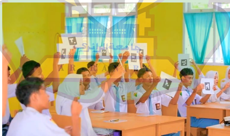
Gambar 1.1 suasana ruang belajar di SMA Negeri 9 Banda Aceh yang mana belajar secara modern dengan menggunakan aplikasi Quizizz

Berdasarkan hasil observasi yang dilakukan di SMA Negeri 9 Banda Aceh, sekolah ini memiliki fasilitas yang cukup memadai dalam mendukung kelancaran proses belajar mengajar. Sarana dan prasarana yang tersedia dirancang untuk menunjang kegiatan akademik maupun nonakademik siswa. Lingkungan sekolah terlihat tertata rapi dan bersih sehingga menciptakan suasana belajar yang kondusif. Setiap fasilitas digunakan sesuai dengan fungsi dan kebutuhannya. Pihak sekolah juga menunjukkan komitmen dalam menjaga dan merawat fasilitas yang ada. Hal ini berpengaruh positif terhadap kenyamanan guru dan siswa dalam proses pembelajaran. Ruang kelas di SMA Negeri 9 Banda Aceh berada dalam kondisi yang baik dan layak digunakan. Setiap ruang kelas dilengkapi dengan meja dan kursi yang memadai bagi siswa dan guru. Ventilasi udara serta pencahayaan di dalam kelas cukup baik sehingga mendukung kenyamanan belajar. Selain itu, sebagian kelas telah dilengkapi dengan papan tulis yang bersih dan mudah digunakan. Penataan ruang kelas juga cukup rapi dan terorganisir. Kondisi ini membantu terciptanya proses pembelajaran yang efektif dan efisien.