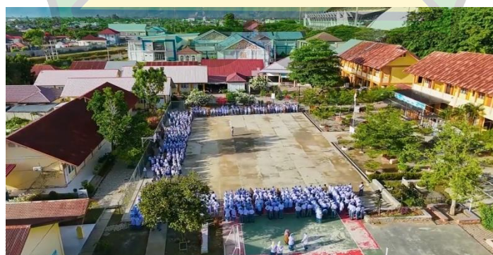
Gambar 2.2 suasana halaman SMA Negeri 9 Banda Aceh

Area halaman sekolah di SMA Negeri 9 Banda Aceh cukup luas dan tertata rapi. Halaman sekolah dimanfaatkan untuk kegiatan upacara bendera dan kegiatan sekolah lainnya. Lingkungan yang asri menciptakan suasana yang nyaman bagi warga sekolah. Pepohonan di sekitar sekolah memberikan kesejukan dan keindahan lingkungan. Area ini juga digunakan siswa untuk beristirahat pada waktu tertentu. Lingkungan sekolah yang nyaman mendukung konsentrasi belajar siswa.