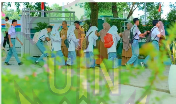
Gambar 2.3 penampakan suasana setiap pagi di SMA Negeri 9 Banda Aceh

Sistem keamanan sekolah di SMA Negeri 9 Banda Aceh juga menjadi bagian dari fasilitas pendukung pembelajaran. Sekolah memiliki petugas keamanan yang bertugas menjaga ketertiban lingkungan sekolah. Pintu gerbang sekolah dikontrol pada jam masuk dan pulang sekolah. Hal ini bertujuan untuk menciptakan rasa aman bagi siswa dan guru. Keamanan yang terjaga mendukung kelancaran kegiatan belajar mengajar. Dengan adanya sistem keamanan yang baik, proses pendidikan dapat berlangsung dengan optimal.