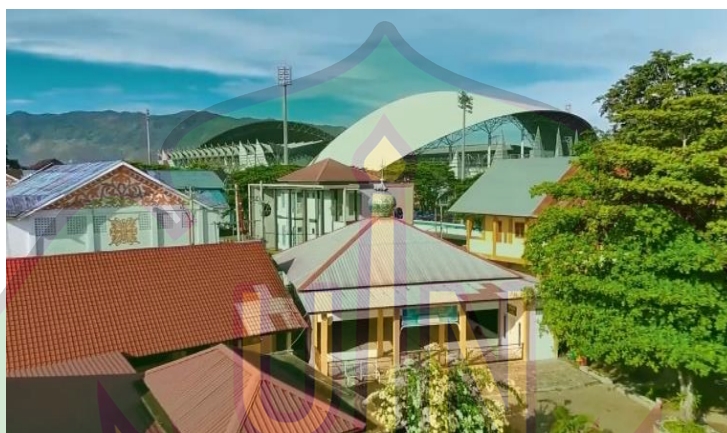
Gambar 2.1 penampakan suasana mushalla SMA Negeri 9 Banda Aceh

Fasilitas mushala di SMA Negeri 9 Banda Aceh digunakan sebagai sarana kegiatan keagamaan warga sekolah. Mushala dalam kondisi bersih dan terawat dengan baik. Fasilitas ini dimanfaatkan siswa dan guru untuk melaksanakan ibadah. Selain itu, mushala juga digunakan untuk kegiatan keagamaan seperti pengajian. Keberadaan mushala mendukung pembentukan nilai spiritual siswa. Nilai spiritual yang baik dapat memengaruhi sikap dan perilaku siswa dalam belajar.