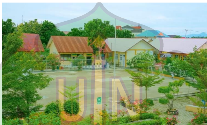
Gambar 1.7 suasana lingkungan SMA Negeri 9 Banda Aceh

Sekolah juga menyediakan fasilitas olahraga seperti lapangan yang digunakan untuk kegiatan pendidikan jasmani. Lapangan ini dimanfaatkan untuk berbagai aktivitas olahraga siswa. Kondisi lapangan cukup luas meskipun perlu perawatan tambahan. Fasilitas olahraga membantu pengembangan kesehatan fisik dan mental siswa. Kegiatan ekstrakurikuler juga memanfaatkan sarana ini. Dengan adanya fasilitas olahraga, siswa dapat menyalurkan bakat dan minatnya.