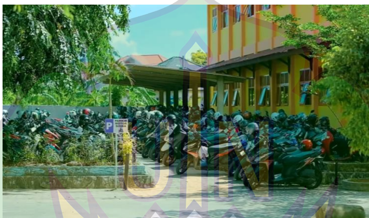
Gambar 2.4 halaman parkir SMA Negeri 9 Banda Aceh

Fasilitas area parkir di SMA Negeri 9 Banda Aceh cukup memadai untuk kendaraan guru, staf, dan siswa. Area parkir tertata rapi dengan pembagian tempat khusus untuk sepeda motor dan mobil. Keamanan kendaraan dijaga oleh petugas sekolah. Area parkir yang luas memudahkan mobilitas warga sekolah. Penataan parkir yang baik juga mendukung keselamatan dan ketertiban. Dengan fasilitas ini, kegiatan belajar mengajar dapat berlangsung tanpa gangguan dari masalah transportasi.