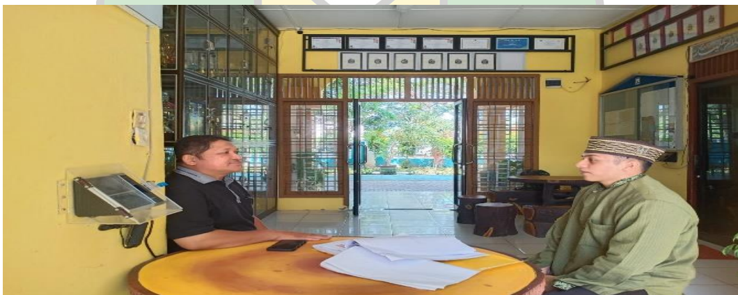
Gambar 2.6 wawancara dengan bapak kepala staf TU SMA Negeri 9 Banda Aceh Peneliti memilih informan kepala staf bagian Tu dikarenakan agar peneliti dapat melihat secara lebih luas Implementasi School Well Being bukan hanya dilingkungan siswa tapi juga berdampak baik kepada Staf bagian umum di sekolah.