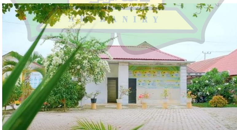
Gambar 1.6 suasana fasilitas sanitasi di SMA Negeri 9 Banda Aceh

Fasilitas sanitasi seperti toilet di SMA Negeri 9 Banda Aceh berada dalam kondisi cukup bersih. Tersedia toilet untuk siswa dan guru yang terpisah. Ketersediaan air bersih mendukung kebersihan dan kesehatan warga sekolah. Meskipun demikian, diperlukan peningkatan dalam hal perawatan secara berkala.