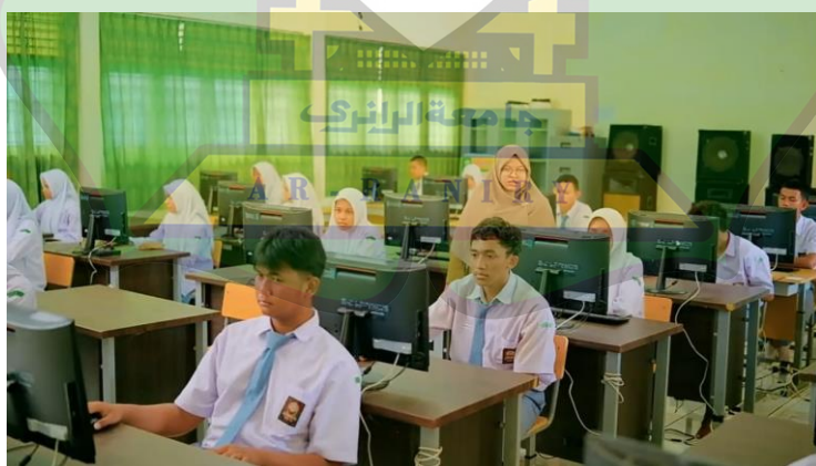
Gambar 1.4 suasana laboratorium komputer di SMA Negeri 9 Banda Aceh Peserta didik belajar didalam laboratorium komputer sekolah

SMA Negeri 9 Banda Aceh juga memiliki fasilitas teknologi pendukung pembelajaran seperti proyektor dan perangkat audio visual. Perangkat ini digunakan oleh guru untuk menyampaikan materi pembelajaran secara lebih menarik. Penggunaan media pembelajaran berbasis teknologi meningkatkan minat belajar siswa. Meskipun belum tersedia di seluruh kelas, fasilitas ini dimanfaatkan secara bergantian. Guru terlihat cukup terampil dalam menggunakan fasilitas tersebut. Hal ini menunjukkan adanya upaya sekolah dalam mengikuti perkembangan teknologi pendidikan.