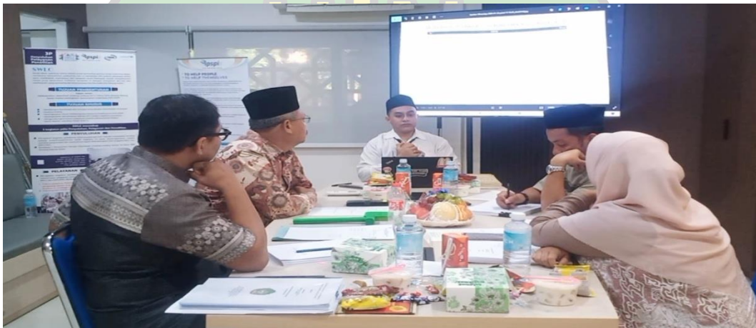
Gambar 3.9 foto suasana sidang hari selasa, 27 Januari 2026