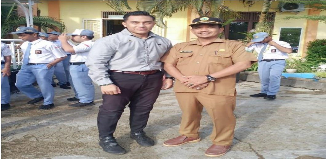
Gambar 2.5 wawancara dengan bapak kepala sekolah SMA Negeri 9 Banda Aceh Kepala Sekolah sebagai pemimpin disekolah yang memiliki jabatan tertinggi yang mana mempunyai tugas yang mencakup beberapa aspek utama diantaranya manajemen sekolah, pengawasan akademik, pengembangan kurikulum, kepemimpinan, penjaminan mutu pendidikan, oleh karena itu tepat kiranya sebagai petinggi disekolah untuk menjadi informan pada penelitian ini dalam menggali informasi terkait penerapan School Well Being di SMA Negeri 9 Banda Aceh.