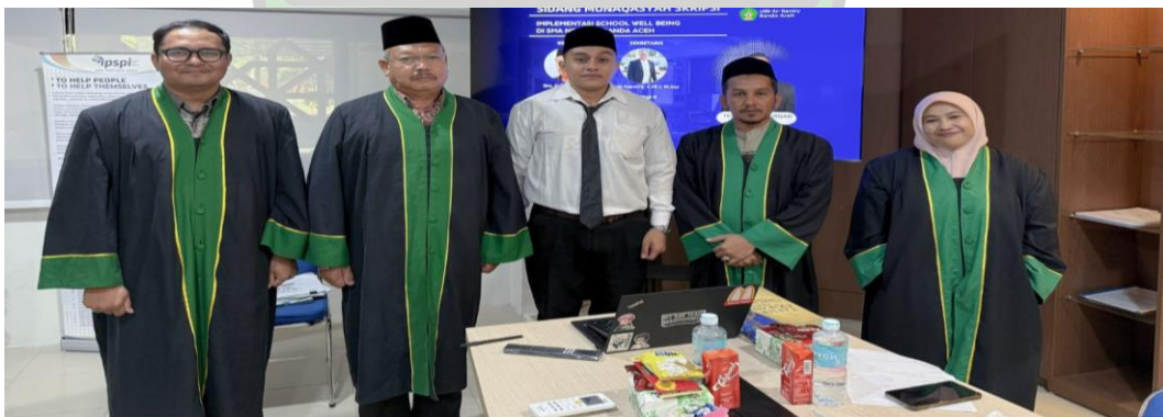
Gambar 4.0 foto Bersama dosen penguji, hari selasa, 27 Januari 2026