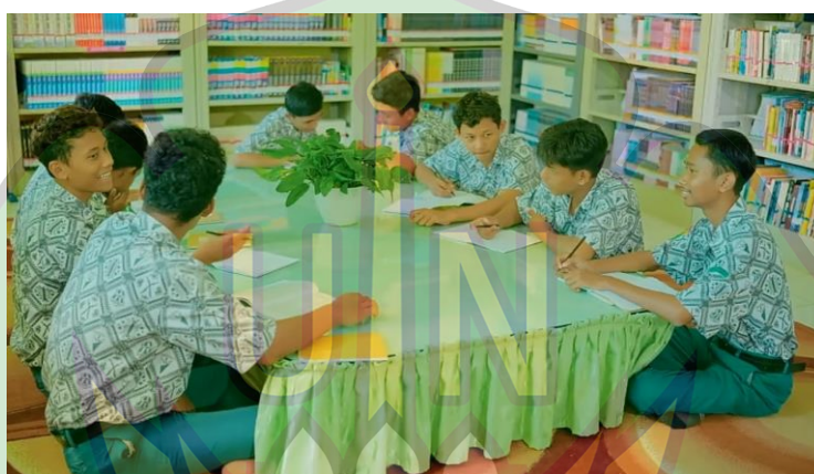
Gambar 1.2 suasana perpustakaan di SMA Negeri 9 Banda Aceh Peserta didik belajar didalam perpustakaan sekolah

Fasilitas perpustakaan di SMA Negeri 9 Banda Aceh berperan penting dalam menunjang kegiatan belajar siswa. Perpustakaan menyediakan berbagai koleksi buku pelajaran, buku referensi, dan bahan bacaan umum. Ruangan perpustakaan cukup nyaman dengan meja dan kursi yang mendukung kegiatan membaca. Siswa dapat memanfaatkan perpustakaan untuk belajar mandiri maupun mencari sumber informasi tambahan. Pengelolaan perpustakaan dilakukan secara tertib dan teratur. Keberadaan perpustakaan ini sangat membantu peningkatan literasi siswa.