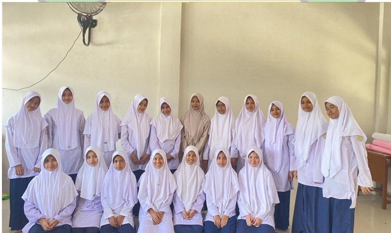
(الباحثة والطالباتُ في الصفِّ السابع "أ")