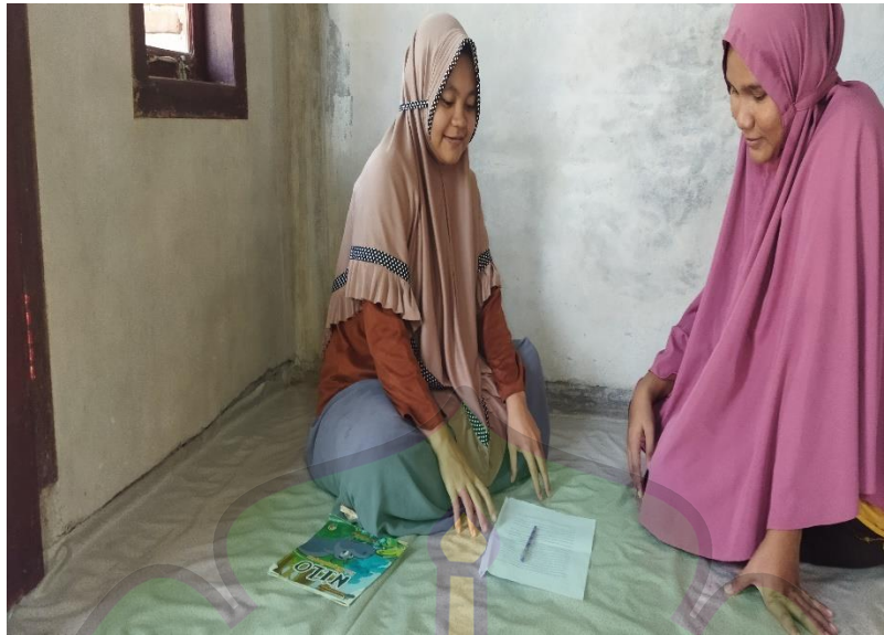
Kegiatan wawancara dengan Ibu SW