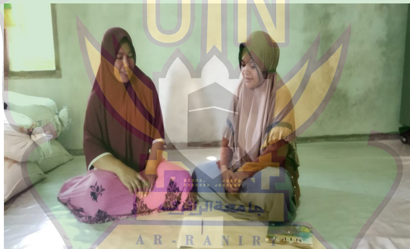
Kegiatan wawancara dengan Ibu Y