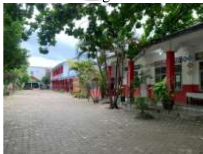
Gambar 4.1 Lokasi Kegiatan Senam Rutin

Program Pos Pembinaan Terpadu yang mengadakan senam lansia rutin setiap minggu juga berdampak baik pada kesehatan lansia, senam kardio ringan untuk lansia dapat membantu meningkatkan kesehatan jantung serta melancarkan peredaran darah sehingga dapat menurunkan risiko penyakit jantung. Senam pada lansia membantu pertumbuhan dan pemeliharaan kekuatan otot dan mencegah osteoporosis dan dapat menyebabkan kehilangan massa tulang.