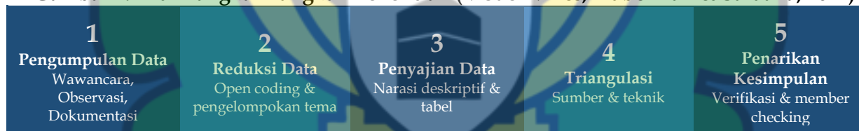
Gambar 1. Alur Langkah-langkah Penelitian (Model Miles, Huberman & Saldana, 2014)

Analisis data mengacu pada model (Miles et al., 2014) yang meliputi reduksi data, penyajian data, dan penarikan kesimpulan. Data hasil wawancara, observasi, dan dokumentasi dianalisis melalui proses open coding, pengelompokan tema, dan interpretasi makna berdasarkan pola temuan di lapangan. Penyajian data dilakukan dalam bentuk narasi deskriptif agar memudahkan pemahaman terhadap hasil penelitian. Keabsahan data dilakukan melalui triangulasi sumber dan triangulasi teknik. Triangulasi sumber dilakukan dengan membandingkan data dari guru BK, kepala madrasah, dan peserta didik, sedangkan triangulasi teknik dilakukan dengan membandingkan hasil wawancara, observasi, dan dokumentasi. Selain itu, peneliti juga melakukan member checking kepada informan untuk memastikan kesesuaian hasil interpretasi data. Penelitian ini turut memperhatikan etika penelitian melalui persetujuan informan dan menjaga kerahasiaan identitas seluruh partisipan penelitian.