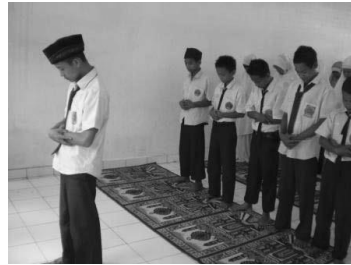
أصلي الصبح جماعة