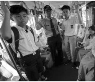
أذهب إلى المدرسة