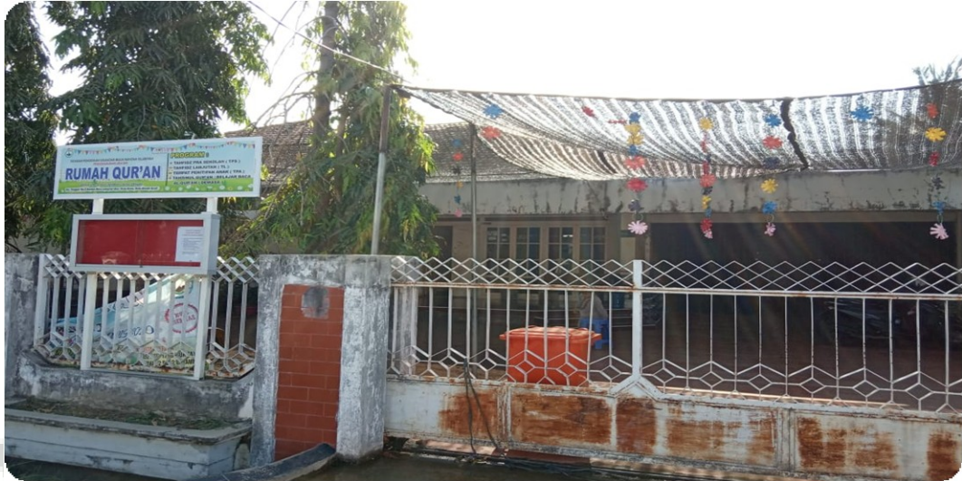
Kantor Lembaga Muslimah Wahdah di Jl. Tenggiri, Bandar Baru, Kuta Alam, Banda Aceh. No 5.